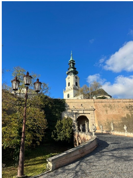
Zdj.7,8. Zamek w Nitrze (Nitriansky hrad)