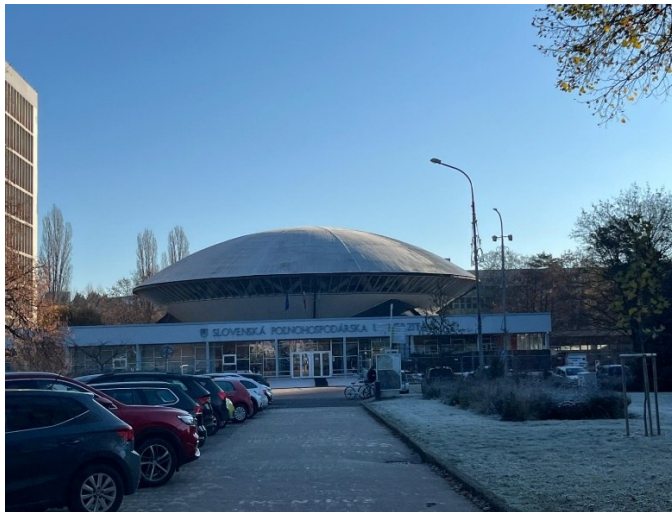
Zdj.1,2. Słowacki Uniwersytet Rolniczy w Nitrze