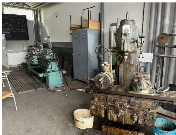
Zdj.5,6. Zwiedzanie warsztatów i laboratoriów.