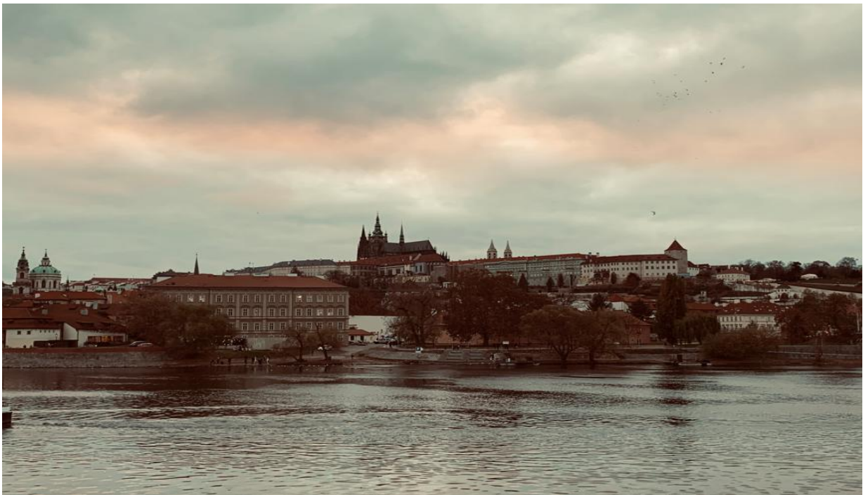
Widok na Zamek na Hradczanach oraz Most Karola