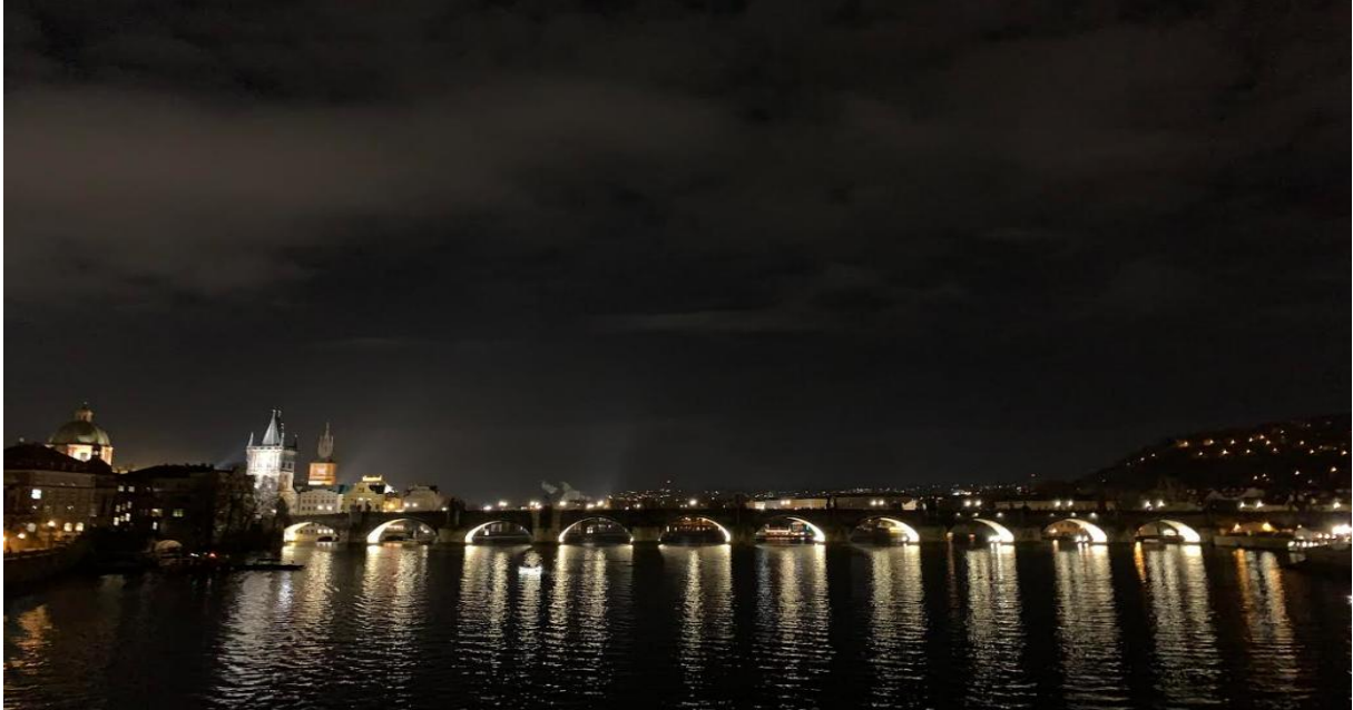
Widok na Most Karola

współpracy w międzynarodowym zespole. Dzięki temu zyskałam cenne doświadczenie oraz międzynarodowe znajomości.