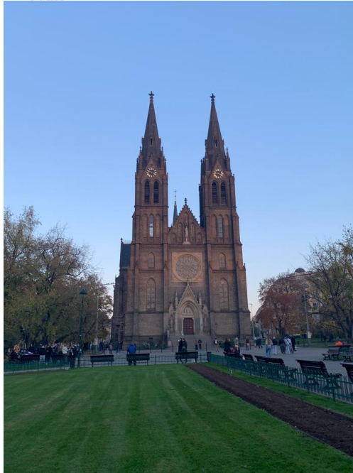
Kościół św. Ludmiły