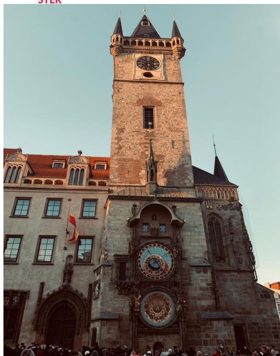
Praski zegar astronomiczny