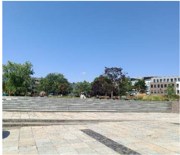
Fot. 17-18. Park miejski.