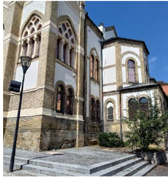
Fot. 25-26. Synagoga.

Udział w stażu w tak wysokiej klasy jednostce naukowej o randze międzynarodowej był dla mnie doskonałą okazją do wymiany doświadczeń oraz pogłębienia wiedzy i kompetencji co zwiększyło mój potencjał naukowy. Dodatkowo wyjazd na staż zagraniczny podniósł moje dotychczasowe umiejętności językowe oraz pozwolił mi na mój rozwój osobisty oraz nawiązanie współpracy z naukowcami z jednostki zagranicznej 😊