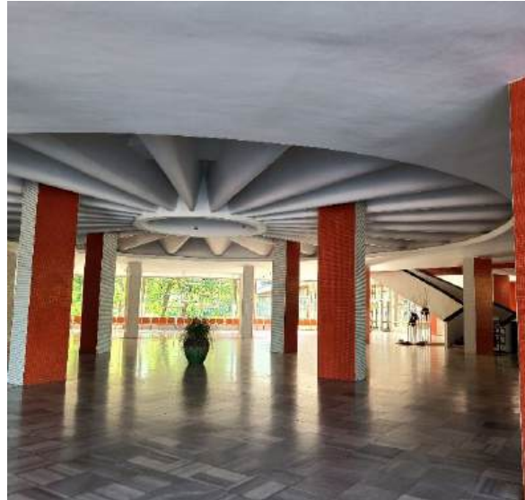
Fot 1-4. Slovak University of Agriculture, Institute of Horticulture, Faculty of Horticulture and Landscape Engineering, Nitra, Slovakia.

Celem wyjazdu było uczestnictwo w badaniach naukowych, pracach badawczo- rozwojowych, poznanie nowych technik badawczych oraz wzajemna wymiana doświadczeń.