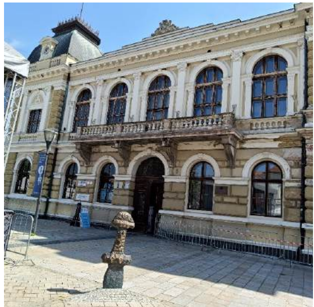
Fot. 19-22. Stare Miasto.