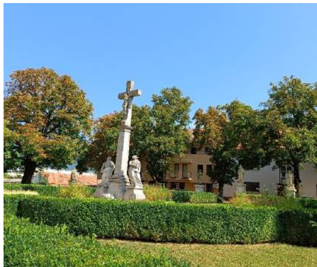
Fot. 23-24. Piarist Church (Kościół Pijarów).