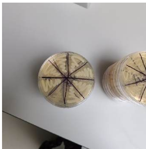
Fot. 14-16. Podłoża mikrobiologiczne używane podczas badań wykonywanych na stażu zagranicznym.

Poza naukową częścią stażu, czas wolny spędzałam zwiedzając okolice oraz najciekawsze miejsca zapoznając się tym samym z kulturą tego regionu.