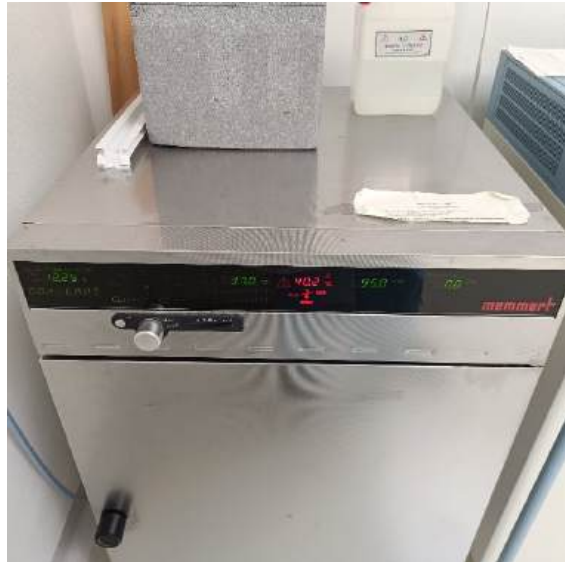
Fot. 8- 13. Sprzęt laboratoryjny znajdujący się na Uniwersytecie (Nitra, Slovakia).