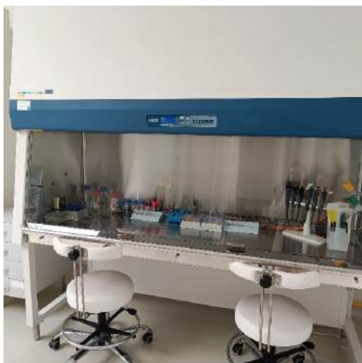
Fot 5-7. Laboratorium w Slovak University of Agriculture, Institute of Horticulture, Faculty of Horticulture and Landscape Engineering, Nitra, Slovakia.

Udział w mobilności zagranicznej dał mi również możliwość udoskonalenia umiejętności praktycznych z zakresu analiz mikrobiologicznych produktów mięsnych z wykorzystaniem nowoczesnego sprzętu znajdującego się na Uniwersytecie.