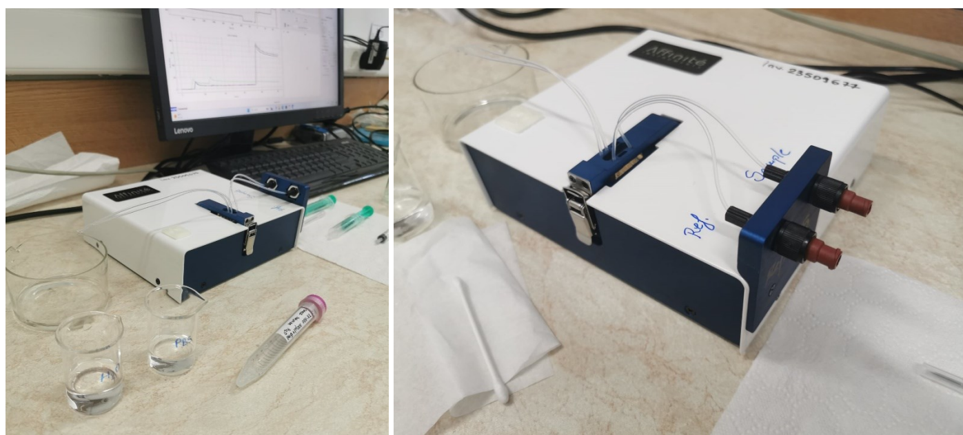
Zdj.2. SPR – plazmonowy rezonans powierzchniowy