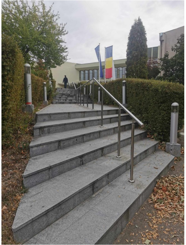
Zdj.5., 6. Droga prowadząca do Transilvania University of Brasov