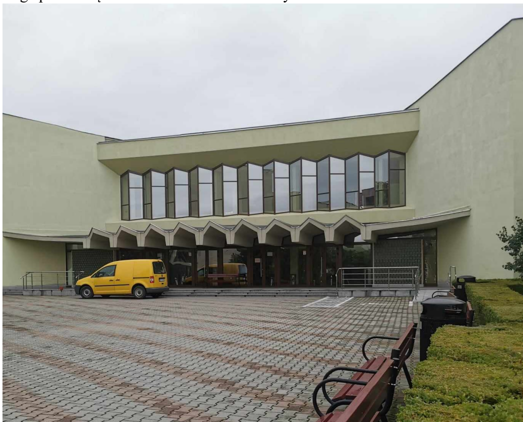
Zdj.7. Główne wejście do Transilvania University of Brasov