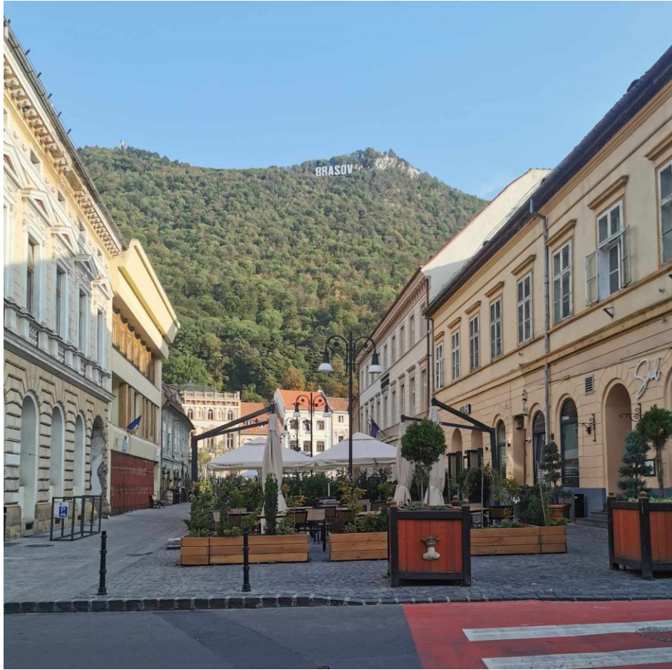
Zdj.3. Stare Miasto w Braszowie