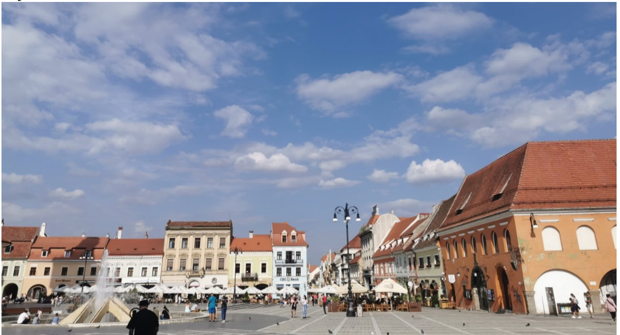
Zdj.4. Stare Miasto w Braszowie