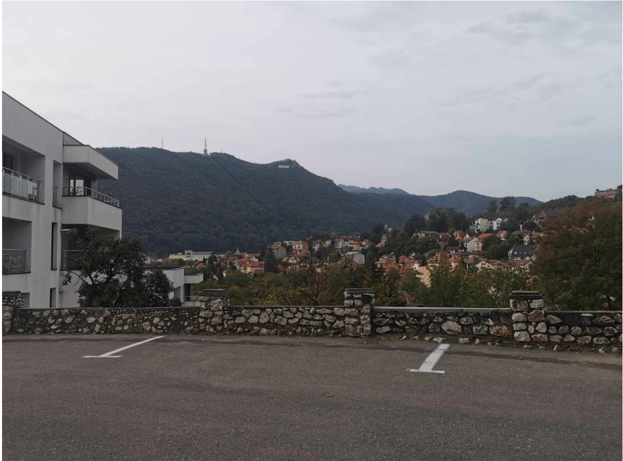
Zdj.8. Widok na panoramę miasta z Transilvania University of Brasov