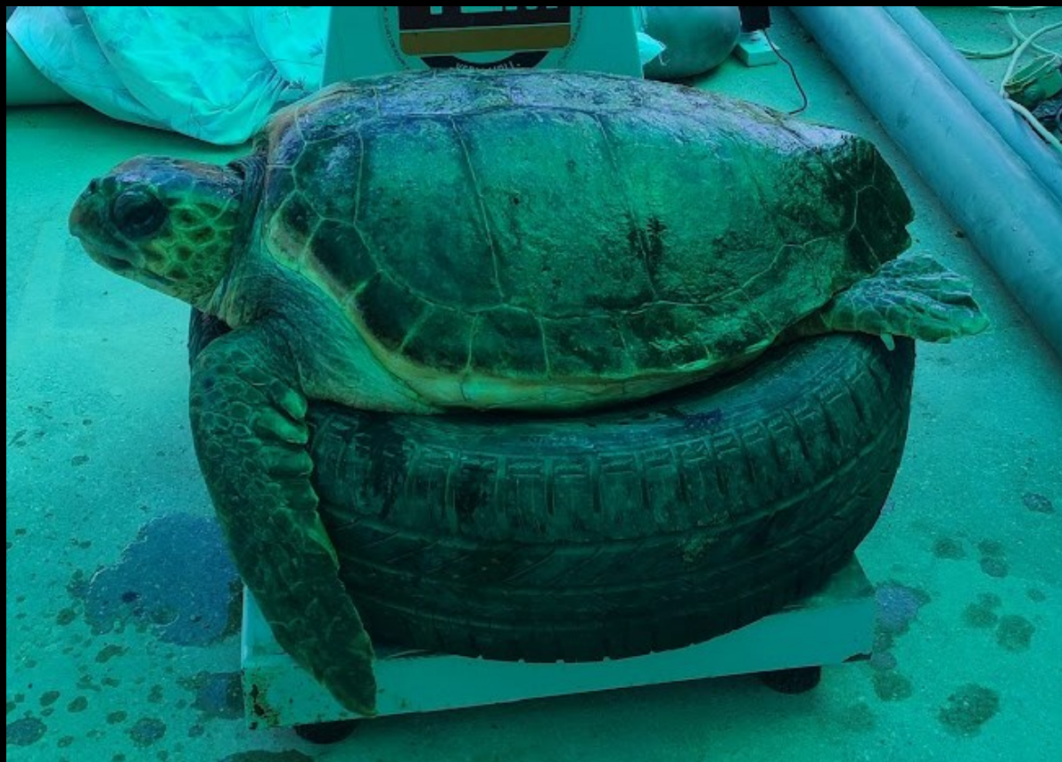
Loggerhead sea turtle