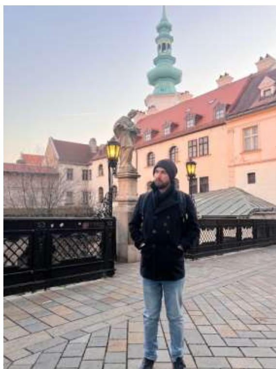
Fot. 4. Bratysława

Odwiedziłem także Bratysławę, stolicę Słowacji, która urzekła mnie swoim różnorodnym charakterem – od urokliwych uliczek Starego Miasta po imponujący Zamek Bratysławski z widokiem na Dunaj. Miasto tętniło życiem, a jego kultura i atmosfera zachęcały do odkrywania kolejnych zakątków.