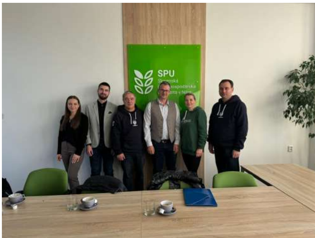
Fot. 3. Spotkanie

Staż zagraniczny na Słowacji, nie tylko wzbogacił mnie pod względem naukowym, ale również dostarczył niezapomnianych wrażeń i wyjątkowych doświadczeń pod względem turystycznym. Słowacja okazała się krajem niezwykle urokliwym, pełnym bogatej historii, pięknej przyrody i gościnnych ludzi. Podczas stażu mieszkałem w mieście Nitra – jednym z najstarszych miast Słowacji, które zachwyliło mnie swoją spokojną atmosferą i historycznym charakterem. Spacerując po górach wokół miasta, miałem okazję podziwiać wspaniałą panoramę Nitry, obejmującą przepiękny zamek w jej centrum.