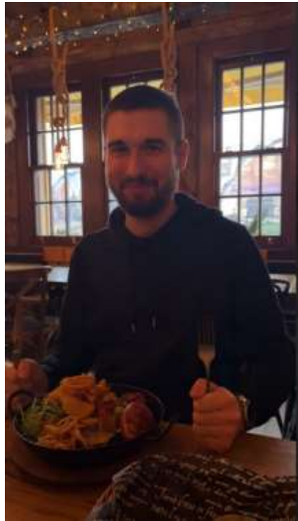
Fot. 7. Słowacka knajpa

Nie mogę też zapomnieć o słowackiej kuchni, która stała się jednym z ważniejszych elementów mojej podróży. Spróbowałem tradycyjnych dań, takich jak bryndzové halušky, kapustnica czy lokše, które zachwyciły mnie swoim smakiem i wyjątkowym charakterem.