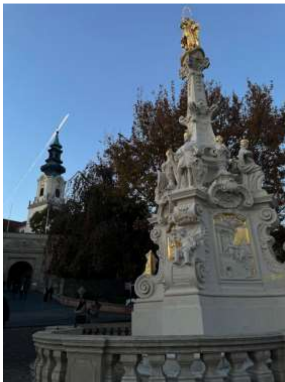
Fot. 4. Nitra

Odwiedziłem także Bratysławę, stolicę Słowacji, która urzekła mnie swoim różnorodnym charakterem – od urokliwych uliczek Starego Miasta po imponujący Zamek Bratysławski z widokiem na Dunaj. Miasto tętniło życiem, a jego kultura i atmosfera zachęcały do odkrywania kolejnych zakątków.