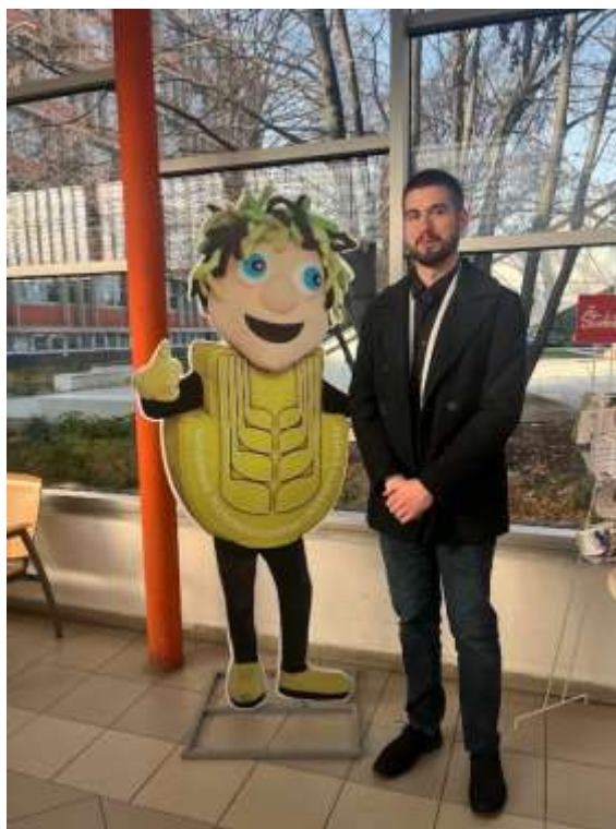
Fot. 1 Kampus Uniwersytetu