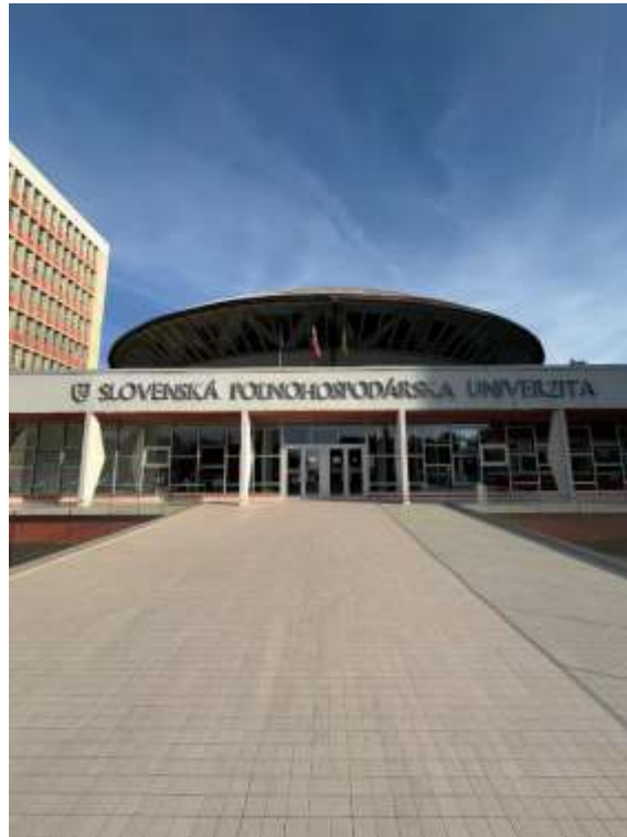
Fot. 2 Kampus Uniwersytetu

Na początku mojego stażu na Slovak University of Agriculture in Nitra miałem okazję uczestniczyć w spotkaniu, które zgromadziło przedstawicieli władz Uniwersytetu Przyrodniczego w Lublinie, gospodarzy z uczelni słowackiej oraz doktorantów realizujących staże w ramach programu NAWA STER. Głównym celem tego wydarzenia było omówienie możliwości nawiązania i pogłębienia współpracy międzyinstytucjonalnej oraz planowanie przyszłych działań w obszarze nauki i dydaktyki. Podczas dyskusji skupiono się na potencjalnych projektach badawczych, wymianie wiedzy i doświadczeń między uczelniami, a także na podsumowaniu dotychczasowych osiągnięć. Spotkanie stworzyło przestrzeń do określenia nowych kierunków rozwoju i współpracy. Wydarzenie to było dla mnie niezwykle inspirujące. Nie tylko umożliwiło nawiązanie nowych kontaktów naukowych, ale także pozwoliło lepiej zrozumieć znaczenie międzynarodowej współpracy akademickiej. Było to doświadczenie, które motywuje mnie do dalszego rozwoju zawodowego i naukowego.