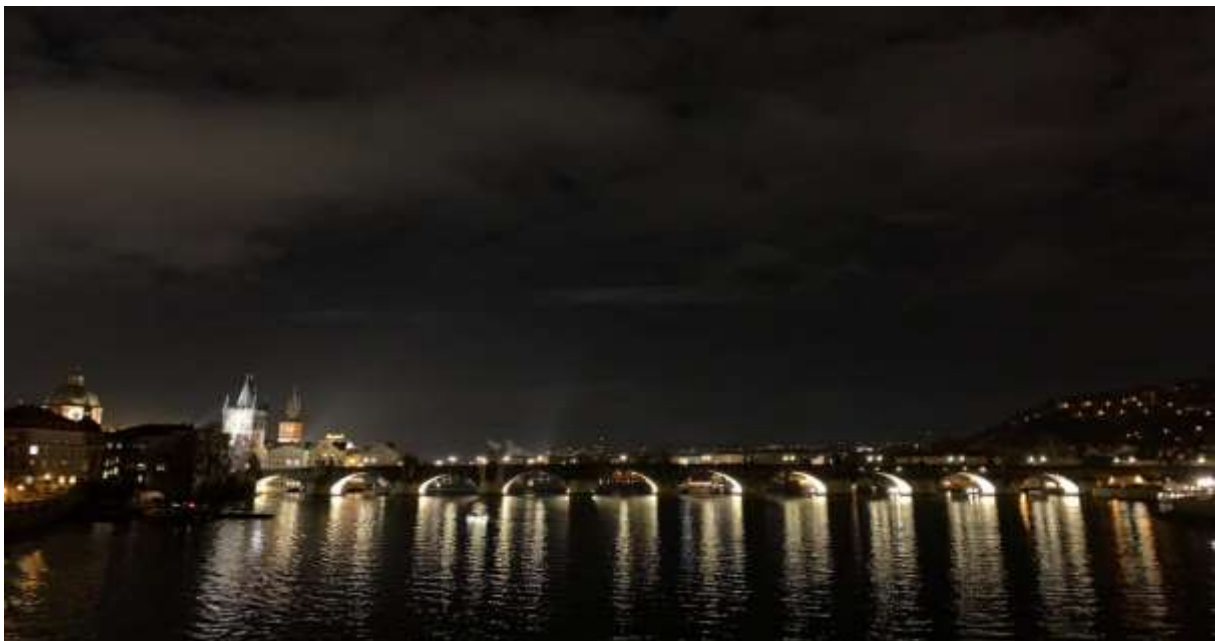
Widok na Most Karola

Staż na Uniwersytecie Karola w Pradze umożliwił mi poszerzenie umiejętności praktycznych w pracy laboratoryjnej. Ponadto, miałam możliwość poznania wielu ciekawych ludzi oraz współpracy w międzynarodowym zespole. Dzięki temu zyskałam cenne doświadczenie oraz międzynarodowe znajomości.