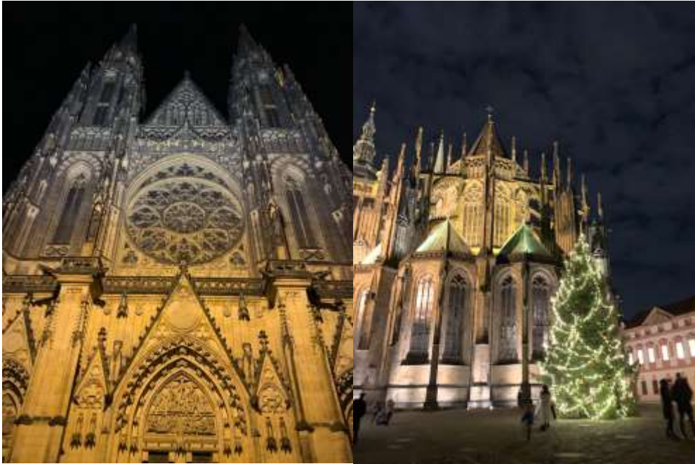
Katedra św. Wita