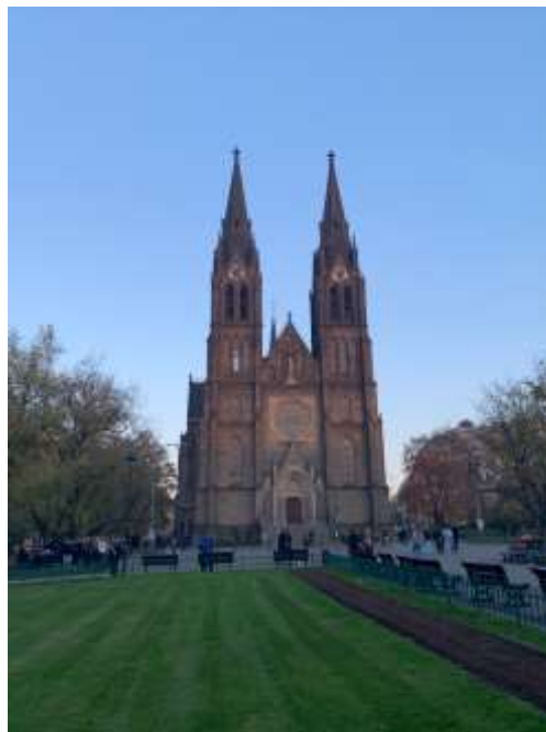
Kościół św. Ludmiły