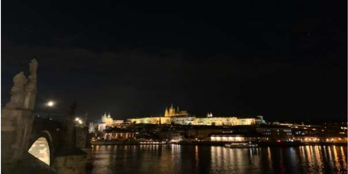
Widok na Zamek na Hradczanach oraz Most Karola