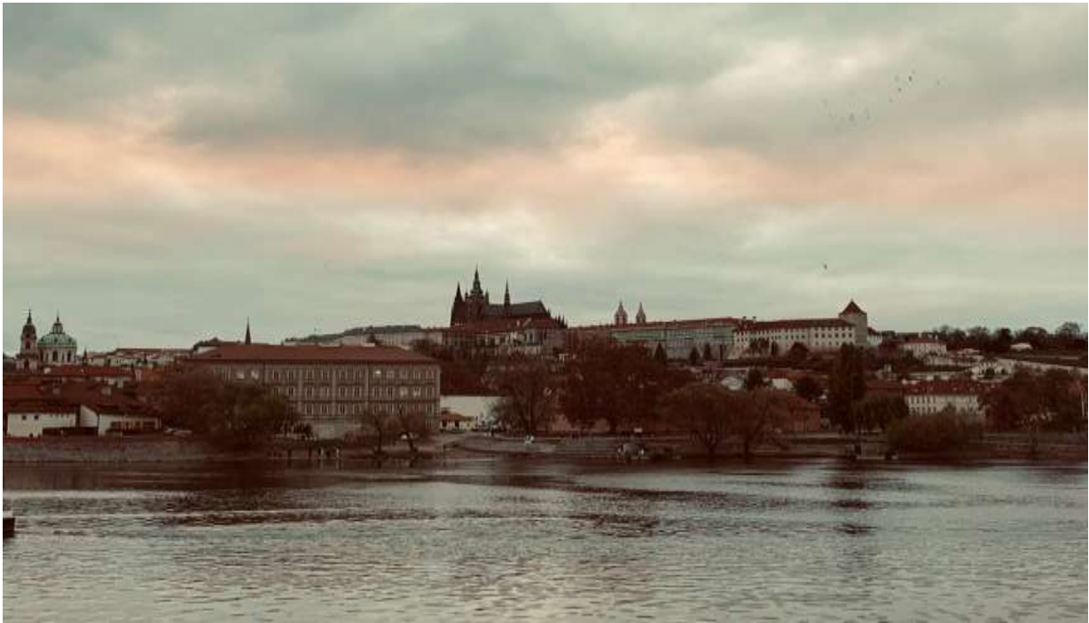
Widok na Zamek na Hradczanach oraz Most Karola