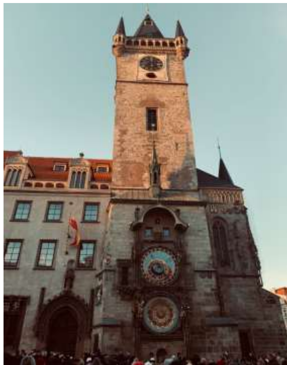
Praski zegar astronomiczny