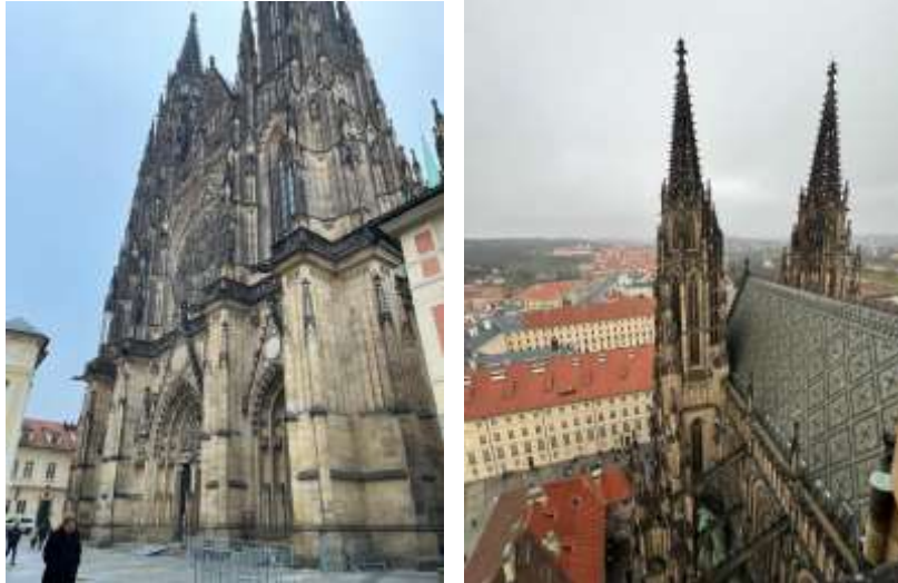
Fot. 28-31. Zwiedzanie Pragi.

Podsumowując stażu w tej jednostce umożliwił był dla mnie cennym doświadczeniem, które znacząco przyczyniło się do mojego rozwoju. Zyskałem nowe umiejętności praktyczne, które pomogły mi lepiej zrozumieć teoretyczne aspekty mojej dziedziny. Dzięki pracy w międzynarodowym środowisku miałem okazję doskonalić swoje kompetencje komunikacyjne i organizacyjne, co wpłynęło na moją pewność siebie oraz umiejętność pracy w zespole. Dodatkowo, miałem szansę zapoznać się z lokalnymi tradycjami i kulturą, a także odwiedzić niezwykle miejsca.