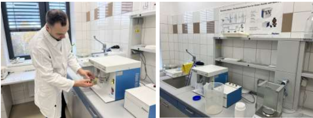
Foto.5-8. Pomiary parametrów jakościowych mąki w laboratoriach uniwersytetu.