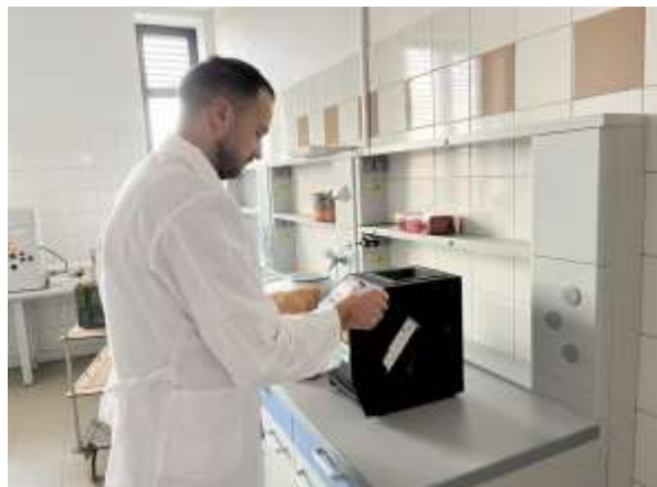
Fot.13-16. Pomiary parametrów jakościowych i ilościowych nasion pszenicy w laboratoriach uniwersytetu.

W ramach stażu zorganizowano wyjście studyjne do hali aquaponicznej, która znajduje się na terenie kampusu uniwersytetu. Przedstawiono w jaki sposób działa system produkcji żywności łączący akwakulturę hodowlę zwierząt wodnych, takich jak ryby, w zbiornikach z hydroponiką, czyli uprawą roślin w wodzie, w której bogata w składniki odżywcze woda z akwakultury jest podawana roślinom uprawianym hydroponicznie.