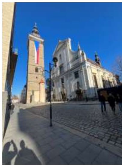
Fot. 21-23. Zwiedzanie starówki w Czeskich Budziejowicach.

Podczas stażu odwiedziłem Czeski Krumlov i Hlubokę, które zrobiły na mnie ogromne wrażenie. Czeski Krumlov zachwyił mnie swoim zabytkowym charakterem, szczególnie malowniczym zamkiem z widokiem na urokliwe miasteczko. W Hluboce natomiast podziwiałem majestatyczny zamek otoczony przepięknymi ogrodami.