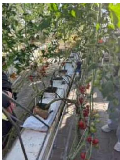
Fot.17-20 Wyjście studyjne do hali aquaponicznej.

Poza naukową częścią stażu, miałem możliwość odkryć uroki Czech oraz spróbowania lokalnych potraw. Spacerując po malowniczej starówce Czeskich Budziejowic, mogłem podziwiać historyczne budowle i poczuć wyjątkową atmosferę tego miejsca. Dodatkowo, miałem okazję uczestniczyć w jarmarku bożonarodzeniowym. Świąteczna aura, wypełniona blaskiem lampek, kolorowymi ozdobami wywarła na mnie ogromne wrażenie.