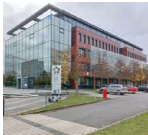
Fot. 1-4. Kampus Uniwersytetu.