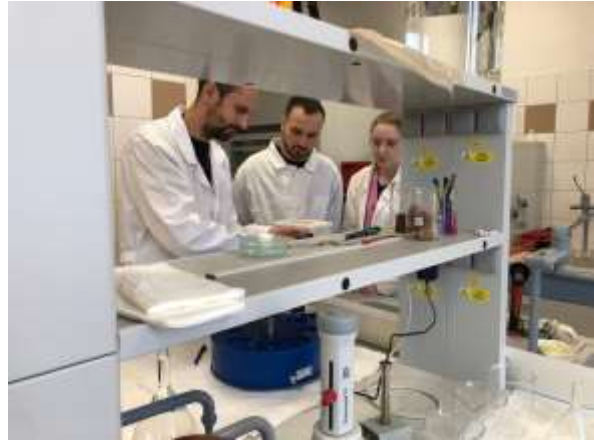
Fot. 9-12. Laboratorium badania gleby.