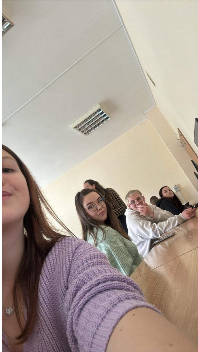
Zajęcia na uczelni