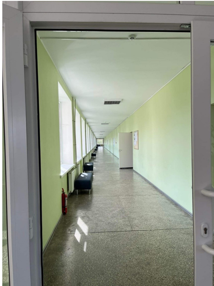
Klaipėdos Valstybinė Kolegija od šrodka