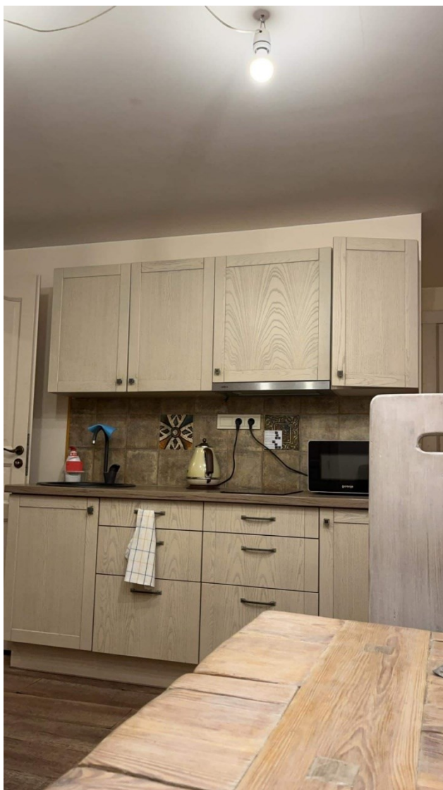
Kuchnia w miejscu zakwaterowania