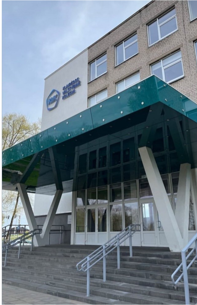
Klaipėdos Valstybinė Kolegija od zewnątrz