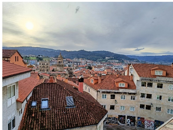
Fot. 15. Widok na miasto Ourense (Hiszpania).