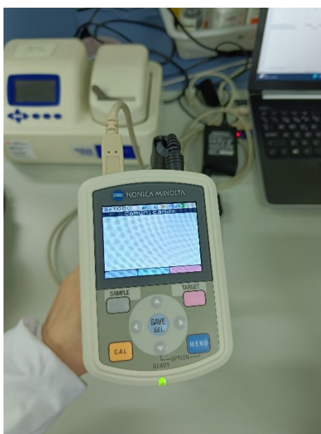
Fot. 9. Sprzęt do oceny barwy wyrobów mięsnych.

Podczas stażu miałam okazję zapoznać się z pracownikami i doktorantami zatrudnionymi na Instytucie jak również zobaczyć wyposażenie tej jednostki. Mogłam także doskonalić swoje umiejętności praktyczne z zakresu podstawowych technik analiz fizykochemicznych produktów mięsnych oraz zapoznać się z wykorzystywanym na Instytucie nowoczesnym sprzętem do analizy związków lotnych.