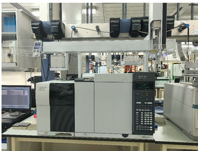
Fot. 13. Nowoczesny sprzęt do analizy związków lotnych.

Poza naukową częścią stażu, czas wolny spędzałam zwiedzając okolice oraz najciekawsze miejsca jak również próbując lokalnych przysmaków tego regionu.