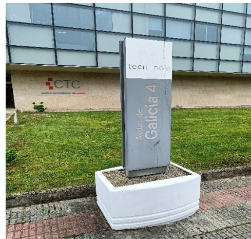
Fot 1-2. Centro Tecnológico de la Carne de Galicia, Avenida de Galicia, Parque Tecnológico de Galicia, San Cibrao das Viñas (Ourense, Hiszpania).