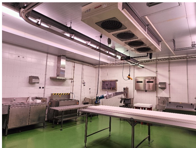
Fot. 12. Jedna z hal produkcyjnych znajdujących się na Instytucie.