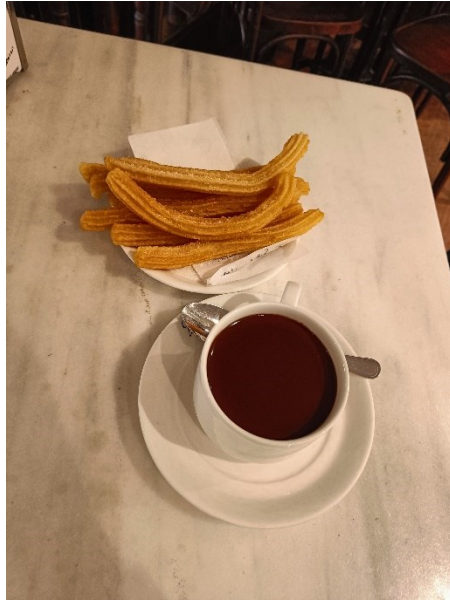
Fot.20. Churros z czekoladą.

Udział w stażu w tak wysokiej klasy jednostce naukowej o randze międzynarodowej był dla mnie doskonałą okazją do wymiany doświadczeń oraz pogłębienia wiedzy i kompetencji z zakresu technologii mięsa, co zwiększyło mój potencjał naukowy. Był to również wspaniały czas, w którym poznałam wielu interesujących ludzi, co w przyszłości może zaowocować współpracą 😊