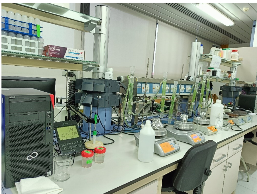
Fot 7-8. Laboratorium w Centro Tecnológico de la Carne de Galicia, Avenida de Galicia (Ourense, Hiszpania).

Podczas stażu miałam okazję zapoznać się z pracownikami i doktorantami zatrudnionymi na Instytucie jak również zobaczyć wyposażenie tej jednostki. Mogłam także doskonalić swoje umiejętności praktyczne z zakresu podstawowych technik analiz fizykochemicznych produktów mięsnych oraz zapoznać się z wykorzystywanym na Instytucie nowoczesnym sprzętem do analizy związków lotnych.