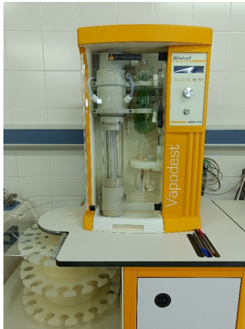
Fot. 10. Sprzęt do oznaczania białka i azotu w produktach mięsnych.