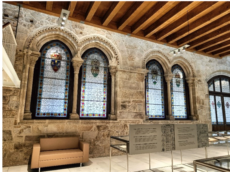
Fot. 14. Claustro de San Francisco.