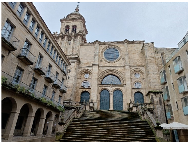
Fot. 16. Catedral de Ourense.