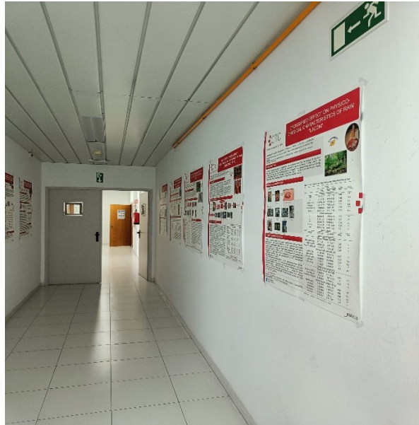
Fot 3-6. Wnętrze Centro Tecnológico de la Carne de Galicia, Avenida de Galicia (Ourense, Hiszpania).

Celem wyjazdu było uczestnictwo w badaniach naukowych, pracach badawczo- rozwojowych, poznanie nowych technik badawczych oraz wzajemna wymiana doświadczeń i wiedzy w obszarze tematycznym związanym z tematyką realizowaną w polskiej jednostce naukowej.