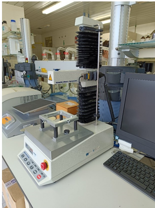
Fot. 11. Sprzęt do pomiaru i badania właściwości tekstury w wyrobach mięsnych.