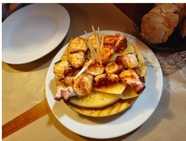
Fot.19. Ośmiornica po galicyjsku.