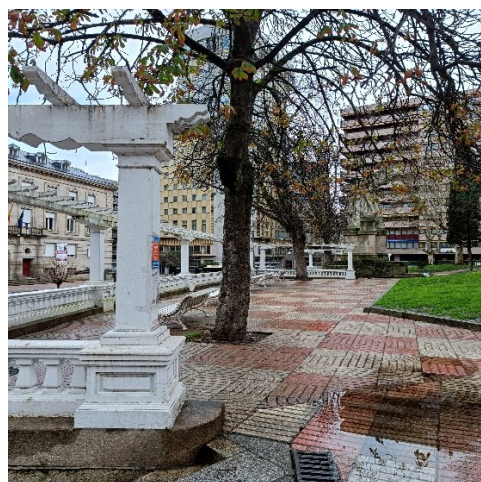
Fot. 17- 18 . Parque de San Lazaro.