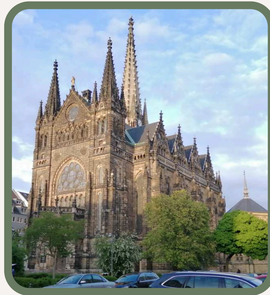
Kościół św. Piotra

Rynek w Lipsku jest centralną częścią miasta, w której można zobaczyć wiele ciekawych budynków, a w tutejszych restauracjach można spróbować wielu specjałów