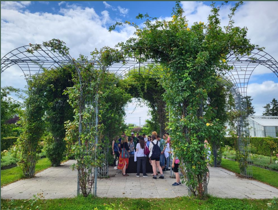
Ogrody tematyczne Wydziału Ogrodnictwa