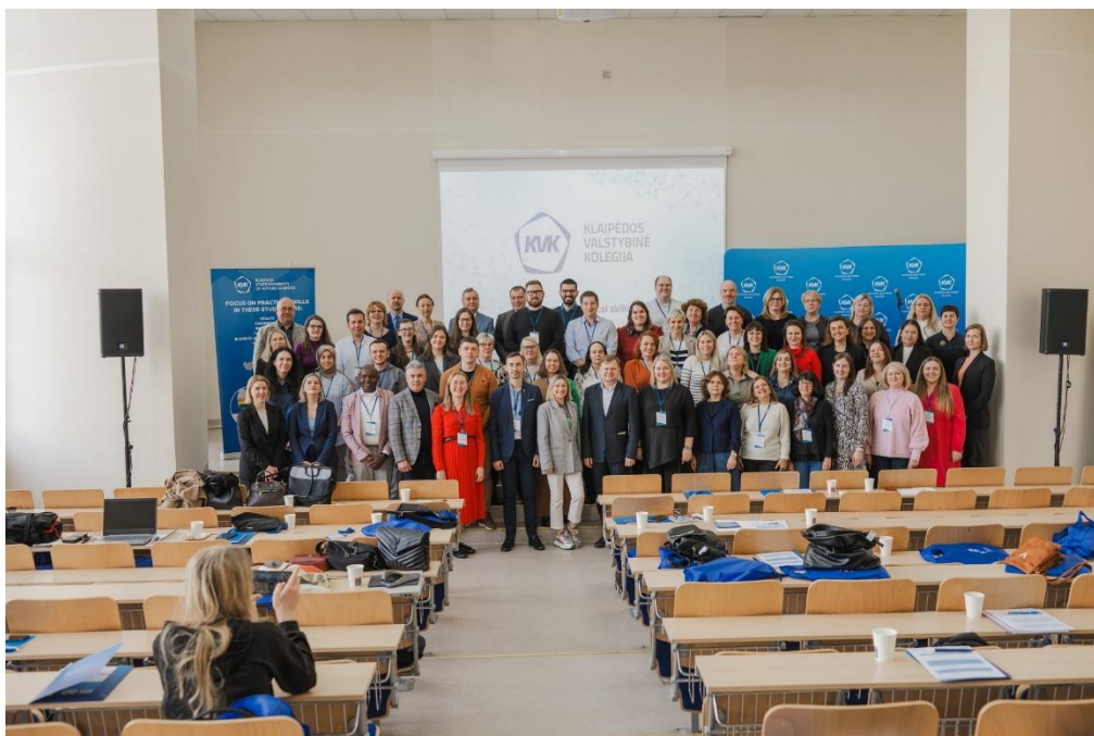
(Fot. 3: Uczestnicy International Week)

Kłajpeda, jako miasto, w którym mieszkają się rozmaite wpływy (m.in. przez lata była to część Prus), różni się nieco od innych większych miast litewskich, jak Wilno czy Kowno. Widać to chociażby w zabudowie, np. obecności konstrukcji szachulcowych. Dodatkowo nadbałtyckie położenia zapewnia dodatkowe interesujące elementy krajobrazu, zarówno tego kulturowego (budynki portowe), jak i przyrodniczego (park narodowy i wydmy na Mierzei Kurońskiej). Nie sposób nie wspomnieć również o ciekawie zaadoptowanych do współczesnej przestrzeni elementach fortyfikacji.