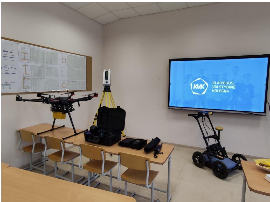
Fot. 2: Sprzęt pomiarowy wykorzystywany w odwiedzanej Katedrze

W ramach wyjazdu miałem okazję przeprowadzić zajęcia dla studentów wydziału, realizujących studia głównie na kierunku Inżynieria Zarządzania Nieruchomościami (poprzednio kierunek ten nazywał się Zarządzanie Nieruchomościami i Cyfrowa Geodezja). Wynikało to z przygotowanych zagadnień, które dotyczyły kartografii i Systemów Informacji Geograficznej (GIS). Podczas pobytu zaprezentowałem także ofertę Uniwersytetu Przyrodniczego oraz badania realizowane w Katedrze Inżynierii Środowiska i Geodezji, dość zbliżone do tych, realizowanych w KVK (monitoring zmian środowiska naturalnego metodami geodezyjnymi, wycena nieruchomości, techniki pomiarowe w inżynierii środowiska).