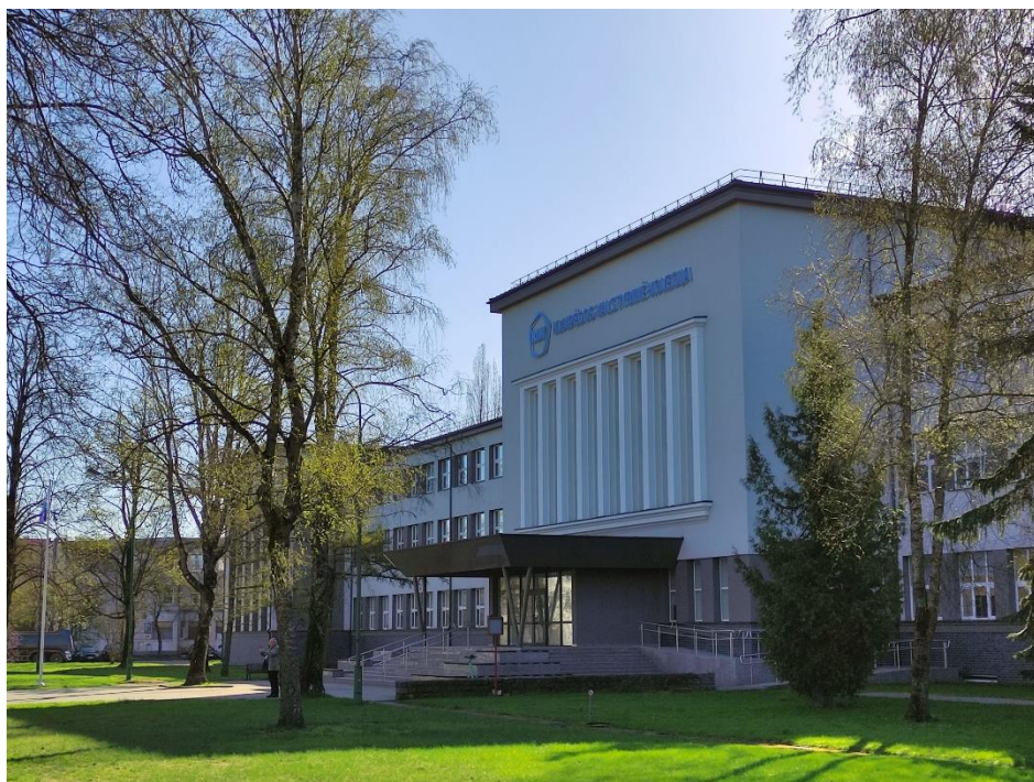
Fot. 1: Wejście do budynku Wydziału Techniki

KVK jest uczelnią kształcącą ok. 3 tys. studentów na trzech wydziałach: biznesu, techniki i nauk o zdrowiu. KVK oferuje 9 kierunków studiów realizowanych w całości po angielsku oraz prawie 300 przedmiotów dla studentów uczestniczących w programie Erasmus+ (w tym z zakresu transportu, geodezji, dietetyki i przemysłu spożywczego). W strukturze Wydziału Techniki znajduje się Katedra Środowiska i Inżynierii Cywilnej, w której realizowałem swój pobyt.