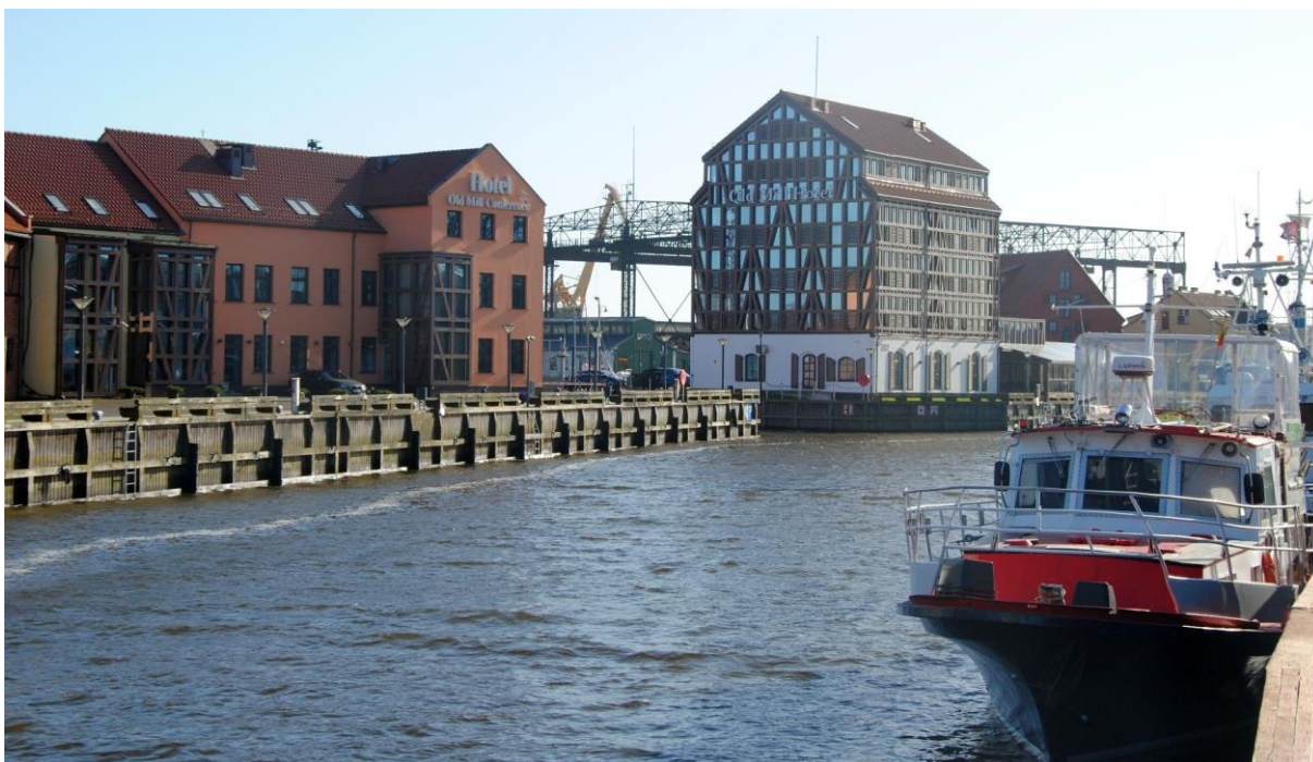
Fot. 5: Zabudowa nad Dangą

Litwa to kraj będący koszykarską potęgą, w którym dyscyplina ta ma status sportu narodowego, o czym świadczy wypełniona na meczach lokalnego Neptunas ponadściecietysięczna hala sportowa. A po meczu można spróbować lokalnej kuchni – bliskiej podniebieniom Polaków, ale jednak innej (chłodnik, placki ziemniaczane, sękacz, kartacze czy – jak to nad Bałtykiem – ryby).