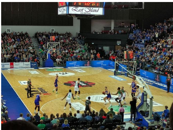
Fot. 6: Mecz koszykówki

Litwa to kraj będący koszykarską potęgą, w którym dyscyplina ta ma status sportu narodowego, o czym świadczy wypełniona na meczach lokalnego Neptunas ponadściecietysięczna hala sportowa. A po meczu można spróbować lokalnej kuchni – bliskiej podniebieniom Polaków, ale jednak innej (chłodnik, placki ziemniaczane, sękacz, kartacze czy – jak to nad Bałtykiem – ryby).