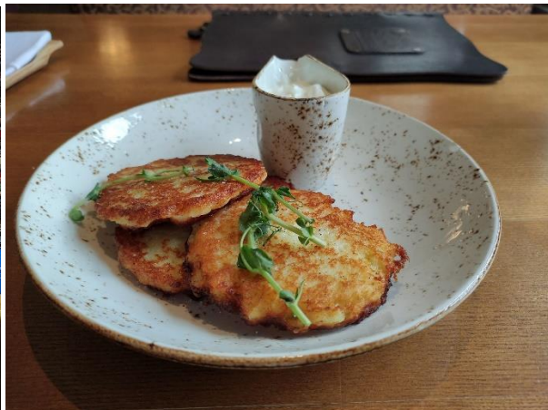
Fot. 7: Placki ziemniaczane