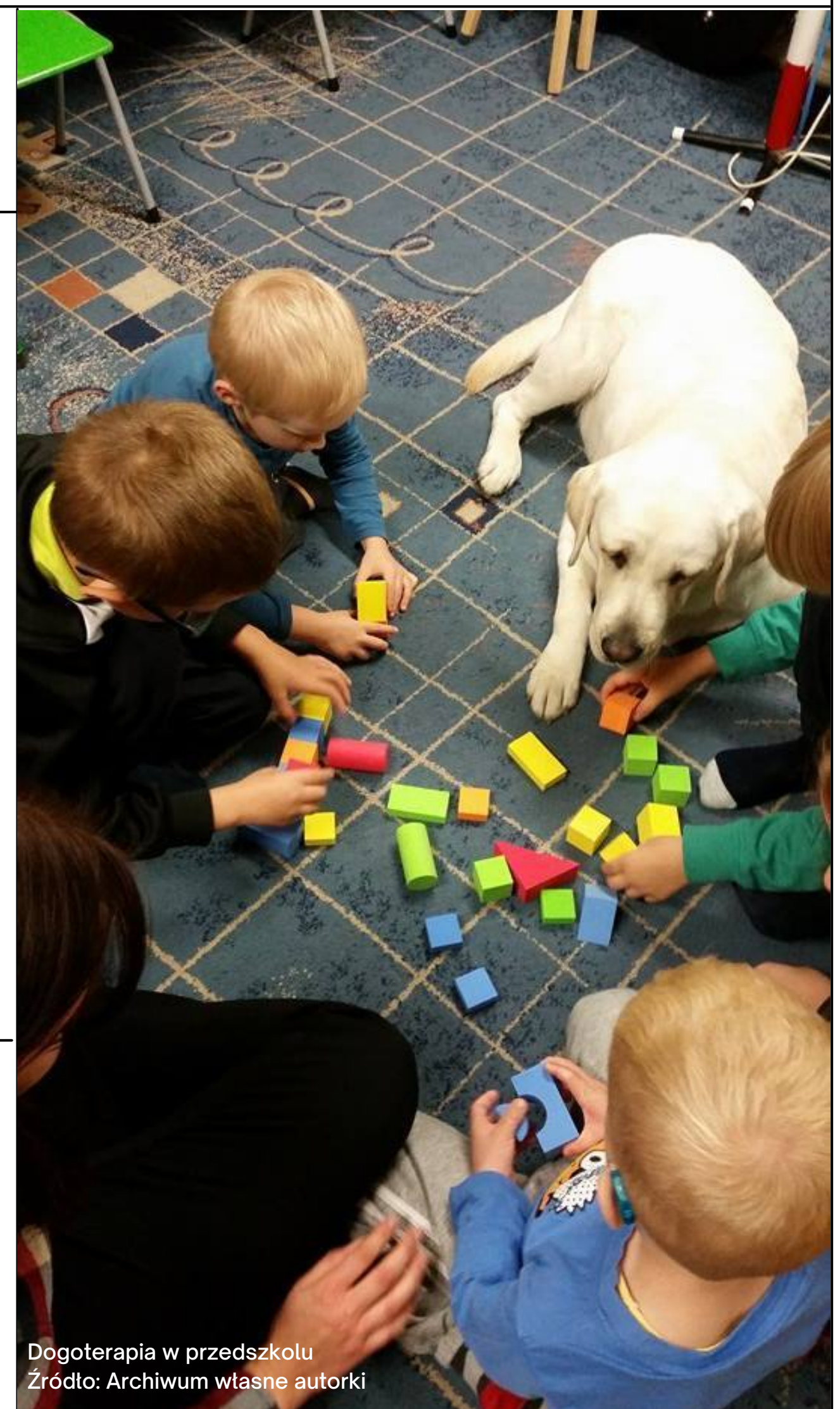
Dogoterapia w przedszkolu