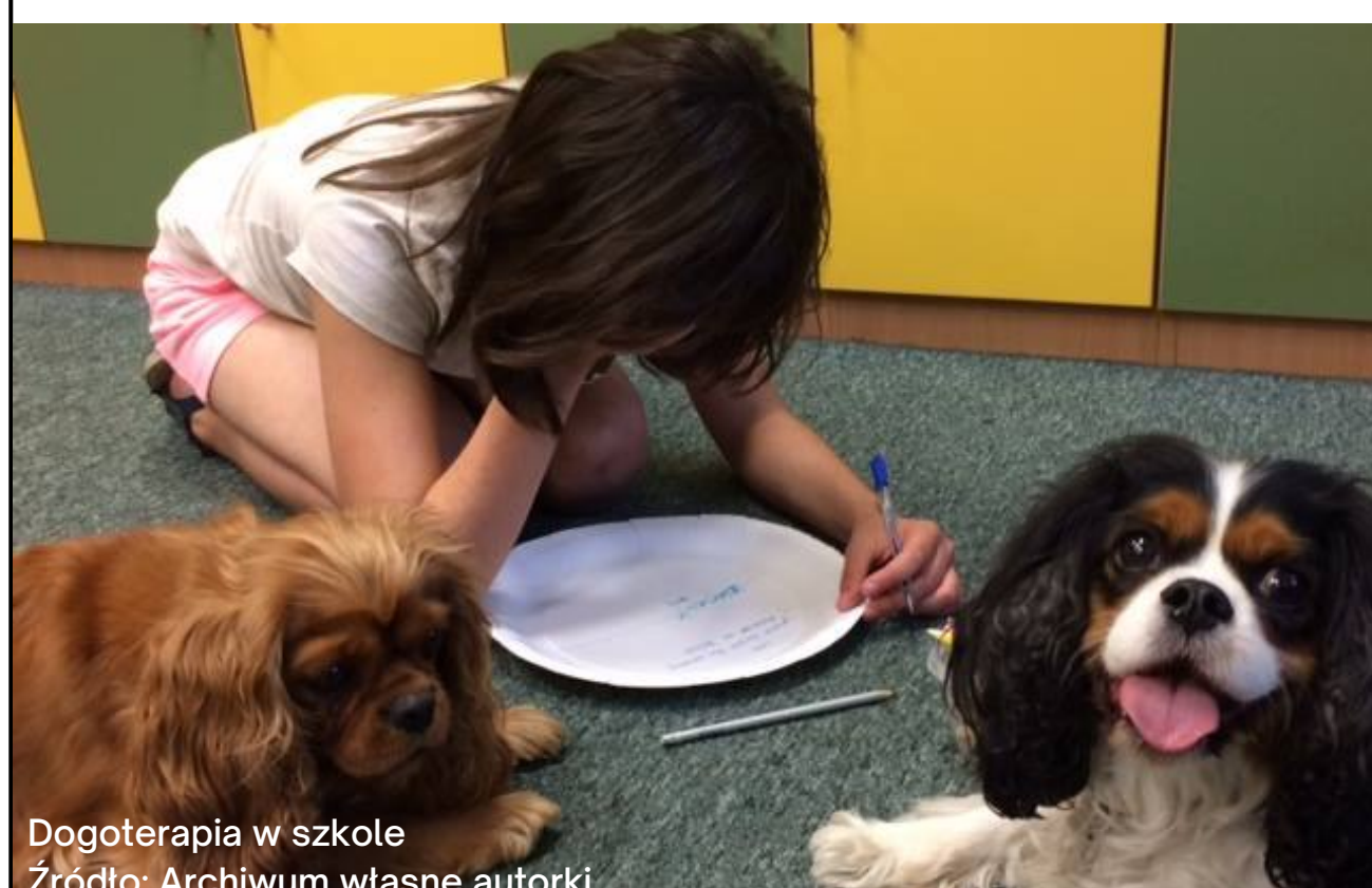
Dogoterapia w szkole

Źródło: Bathut G., Ogródzka-Mazur E. (red), Zwierzęta w kulturze i wychowaniu