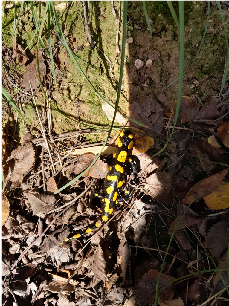
Zdjęcie powyżej: salamandra plamista spotkana niedaleko Splitu podczas spaceru