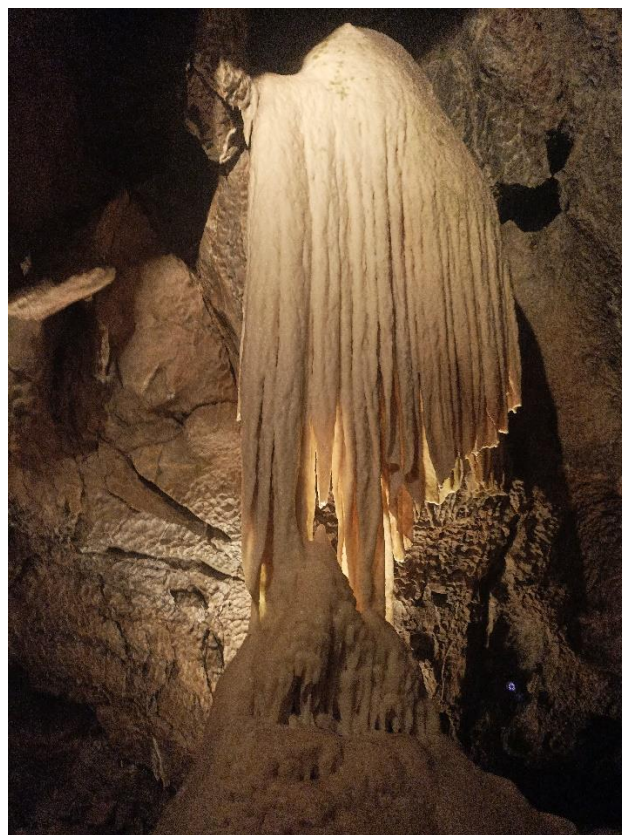
Fot. 5. Szata naciekowa Jaskini Punkvy