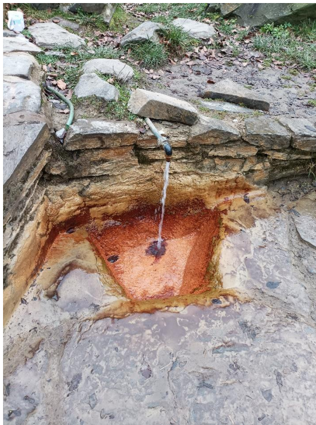
Fot. 4. Przekształcony wypływ źródła Těšíkovská Kyselka