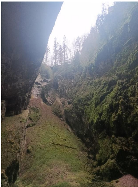
Fot. 6. Przepaść Macochy

Miałyśmy również okazję przybliżyć sobie kulturę i dziedzictwo narodowe Czechów, spacerując po Ołomuńcu i podziwiając jego zabytki. Miasto, położone u ujścia Młyńskiego Potoku i Bystrzycy do Morawy, jest jednym z największych miast w Czechach i historyczną stolicą Moraw. Rozległe ołomunieckie Stare Miasto (Fot. 7) jest drugim, po Starym Mieście Pragi, największym zespołem zabytkowym w Czechach. Ołomuniec znany jest m.in. z Katedry św. Wacława (Fot. 7, 8), Kolumny Trójcy Świętej czy gotyckiego ratusza (Fot. 9). Niektóre jednostki Uniwersytetu Palackiego znajdują się w zabytkowych i klimatycznych budynkach, przystosowanych do współczesnych realiów i potrzeb studentów oraz pracowników (Fot. 10)