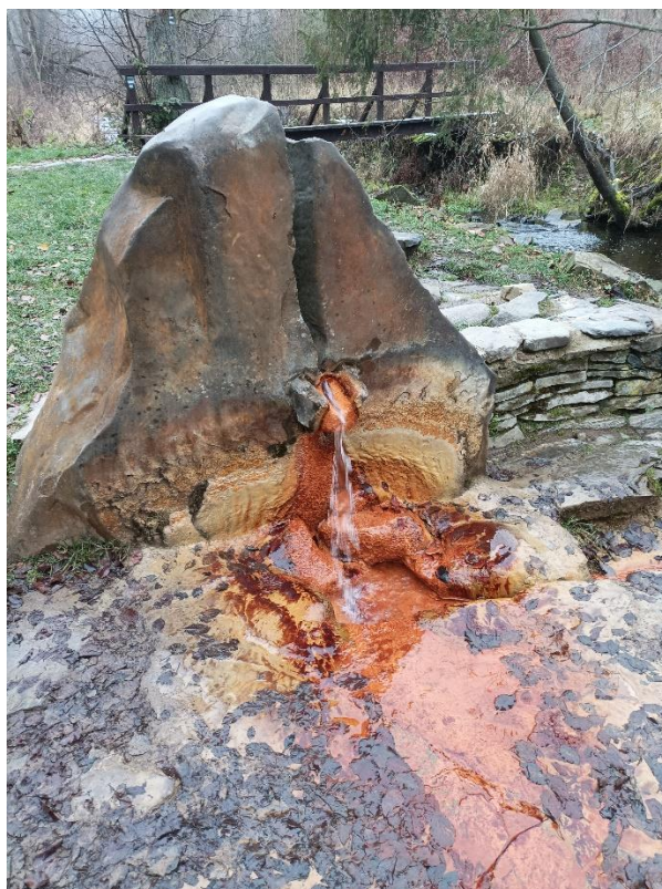
Fot. 3. Těšíkovská Kyselka