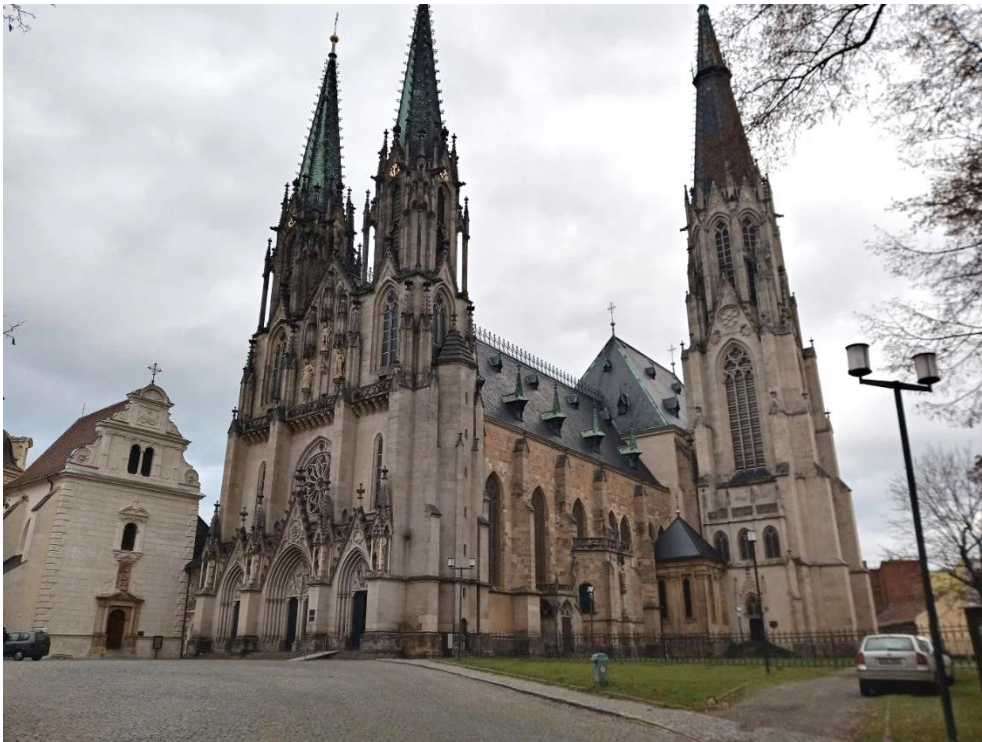
Fot. 8. Katedra św. Wacława ze 100 m wieżą