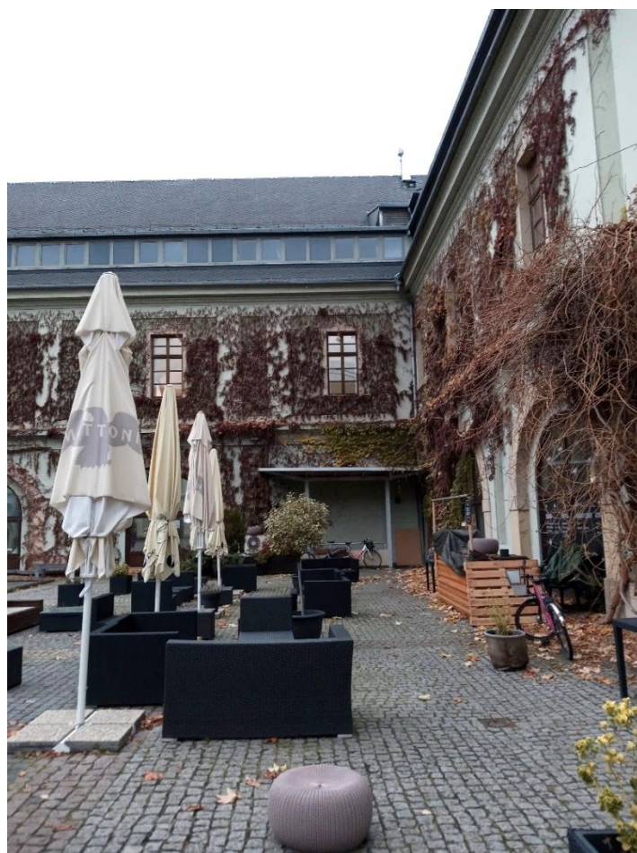
Fot. 10. Zbrojownia dziedzińca Uniwersytetu Palackiego w Ołomuńcu