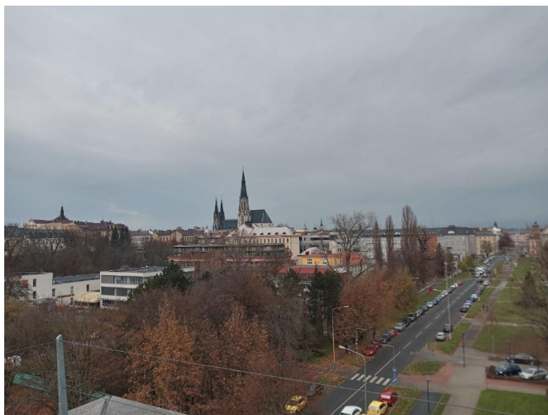
Fot. 7. Widok z siedziby Wydziału Nauk Ścisłych na Stare Miasto (w tle katedra św. Wacława)

Miałyśmy również okazję przybliżyć sobie kulturę i dziedzictwo narodowe Czechów, spacerując po Ołomuńcu i podziwiając jego zabytki. Miasto, położone u ujścia Młyńskiego Potoku i Bystrzycy do Morawy, jest jednym z największych miast w Czechach i historyczną stolicą Moraw. Rozległe ołomunieckie Stare Miasto (Fot. 7) jest drugim, po Starym Mieście Pragi, największym zespołem zabytkowym w Czechach. Ołomuniec znany jest m.in. z Katedry św. Wacława (Fot. 7, 8), Kolumny Trójcy Świętej czy gotyckiego ratusza (Fot. 9). Niektóre jednostki Uniwersytetu Palackiego znajdują się w zabytkowych i klimatycznych budynkach, przystosowanych do współczesnych realiów i potrzeb studentów oraz pracowników (Fot. 10)