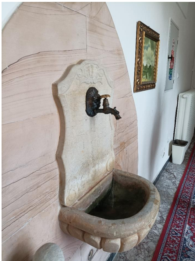
Fot. 2. Uzdrowisko Slatinice