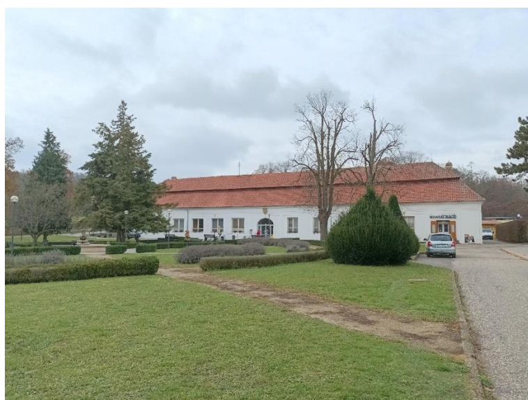
Fot. 1. Budynek uzdrowiska

Zwieńczeniem szkolenia były warsztaty terenowe, przybliżające specyfikę naturalnych wpływów wód podziemnych (źródła) na obszarze krasu Morawskiego. Program szkolenia obejmował wizytę w uzdrowisku Slatinice (Fot. 1-2) oraz prezentację źródła żelazistego Těšíkovská Kyselka (Fot. 3-4). Podziwianie krasu Morawskiego zakończyliśmy wycieczką po jaskiniach Punkvy (Fot. 5-6).