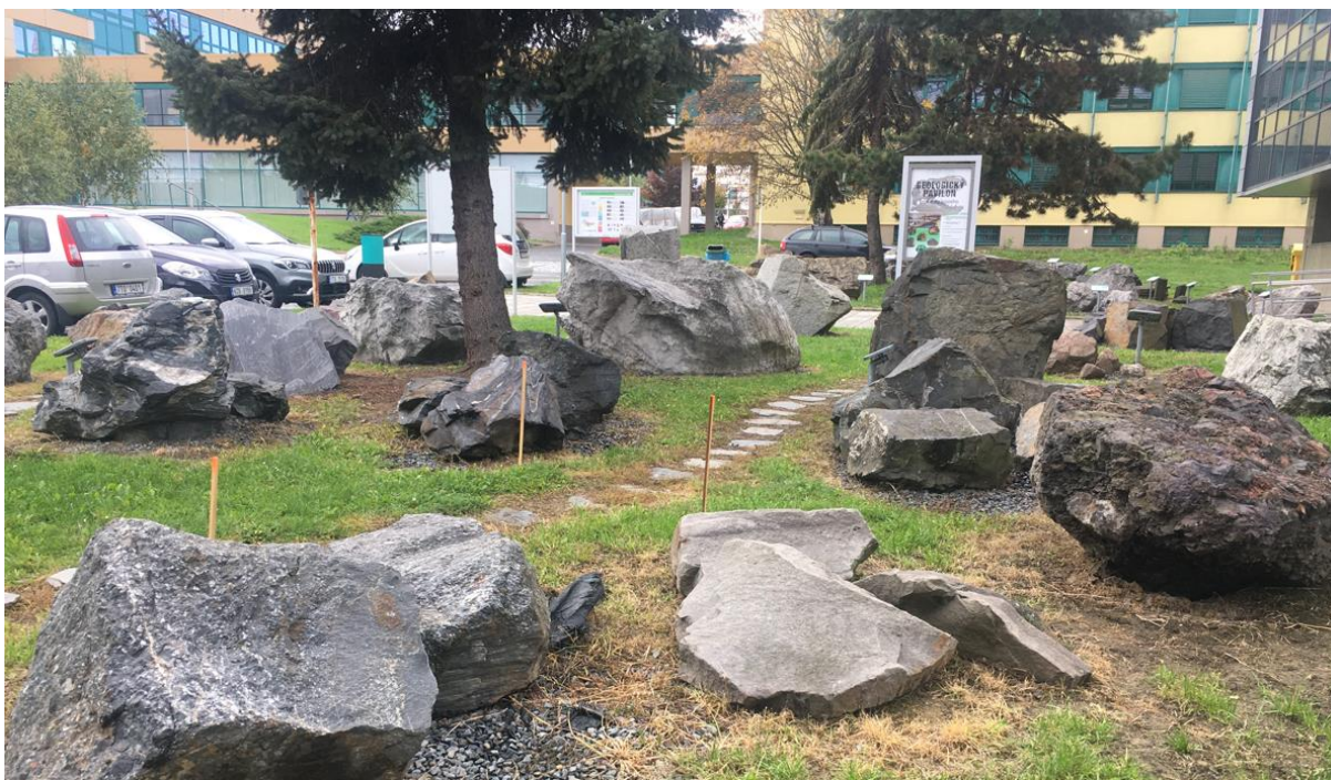
Kampus w Ostrawie (Paruba)