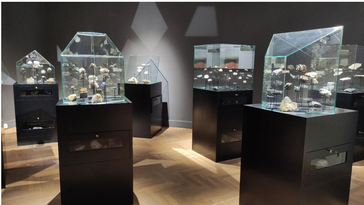
Ekspozycja w Muzeum Regionalnym