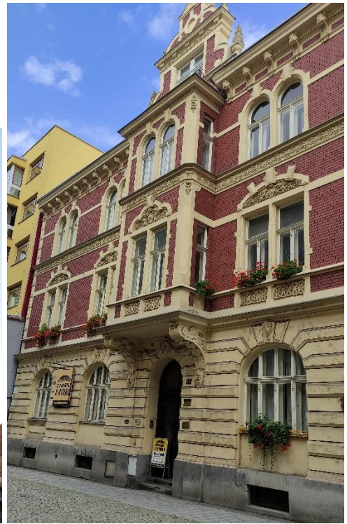
Kamienice Starego Miasta