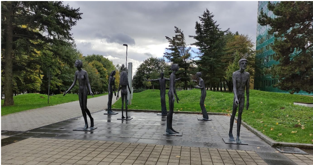
Kampus w Ostrawie (Paruba)