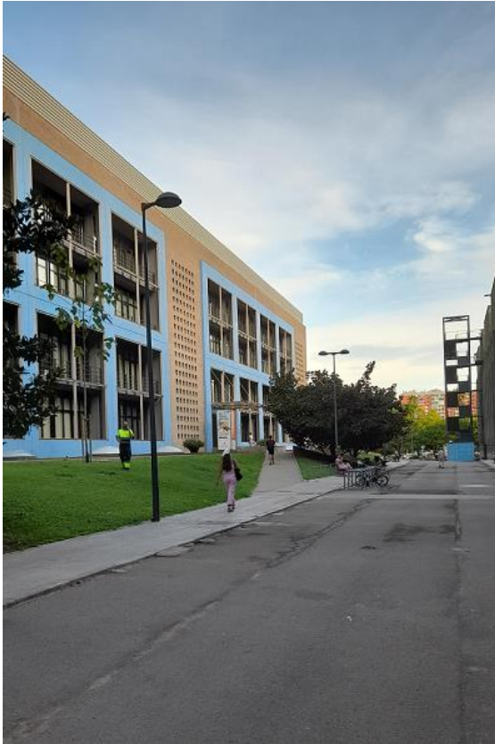
Fig. 1 Campus Bellvitge