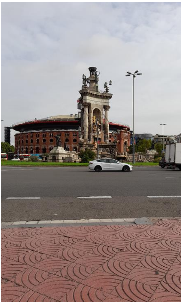
Fig 3 Plaza España Barcelona