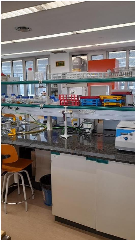
Fig. 2 Pracownia mikrobiologiczna