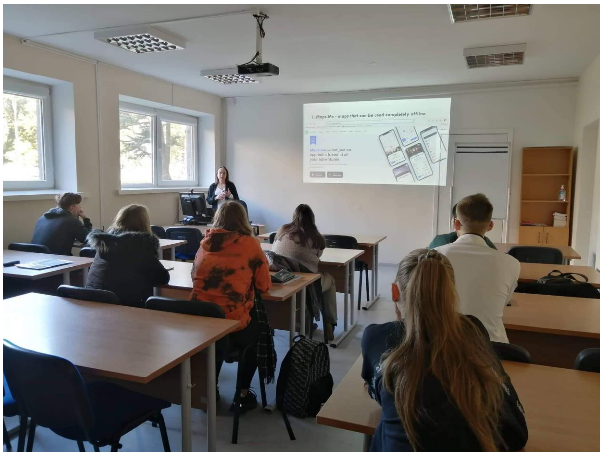
Fot. 13. Zajęcia dla studentów kierunku Tourism Business

Do Kłajpedy dojechaliliśmy samochodem, a po miejscowości poruszaliśmy się głównie pieszo. Jest również możliwość korzystania z komunikacji miejskiej i rowerów miejskich.