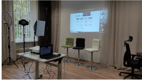
Fot. 9-10. Nowe sale laboratoryjne