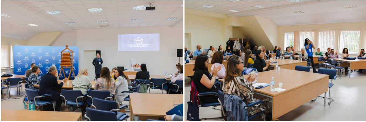
Fot. 1-4. Inauguracja 17th International Week "Quality of studies: challenges and opportunities"

Jednym z punktów programu była prezentacja uczelni, które brały udział w wydarzeniu studentom z Klaipeda State University of Applied Sciences (fot. 5-7). Jako jeden z wystawców prezentowaliśmy materiały promocyjne Uniwersytetu Przyrodniczego w Lublinie i odpowiadaliśmy na pytania studentów dotyczące przyjazdu na nasz Uniwersytet na Erasmusa. Mieliśmy również okazję porozmawiać z innymi wystawcami o ich doświadczeniach naukowych i badawczych. Wymieniliśmy dane kontaktowe, informacje o organizowanych w naszych Instytucjach konferencjach naukowych.