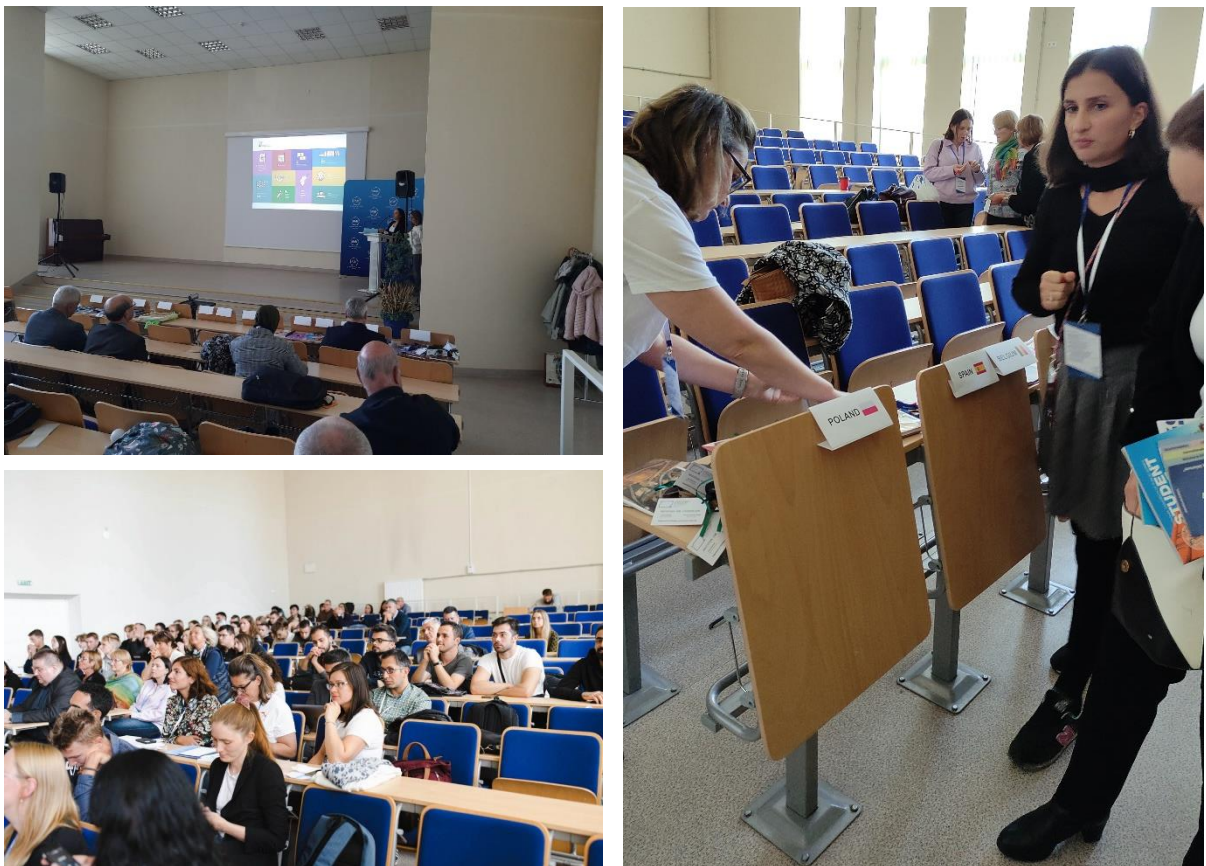
Fot. 5-7. Udział w Międzynarodowych Targach Naukowych i prezentacja Uniwersytetu Przyrodniczego w Lublinie

Jednym z punktów programu była prezentacja uczelni, które brały udział w wydarzeniu studentom z Klaipeda State University of Applied Sciences (fot. 5-7). Jako jeden z wystawców prezentowaliśmy materiały promocyjne Uniwersytetu Przyrodniczego w Lublinie i odpowiadaliśmy na pytania studentów dotyczące przyjazdu na nasz Uniwersytet na Erasmusa. Mieliśmy również okazję porozmawiać z innymi wystawcami o ich doświadczeniach naukowych i badawczych. Wymieniliśmy dane kontaktowe, informacje o organizowanych w naszych Instytucjach konferencjach naukowych.