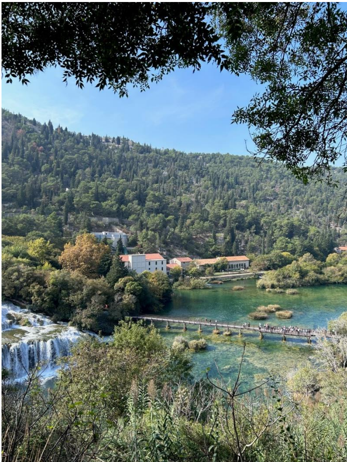
Park Narodowy Krka