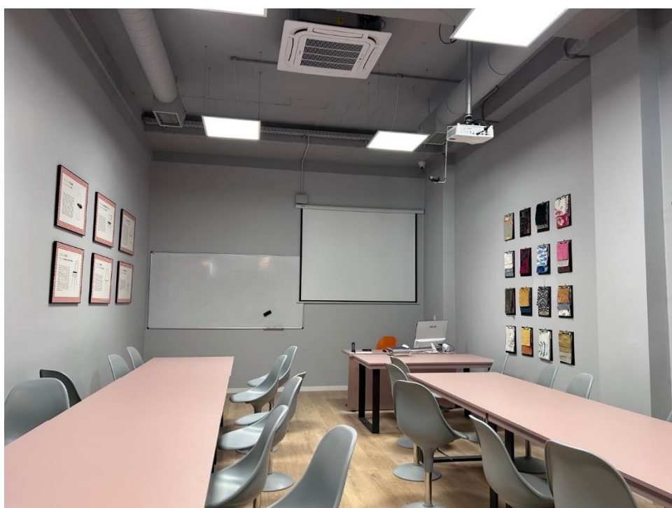
Na zdjęciach jedna z sal wykładowych.