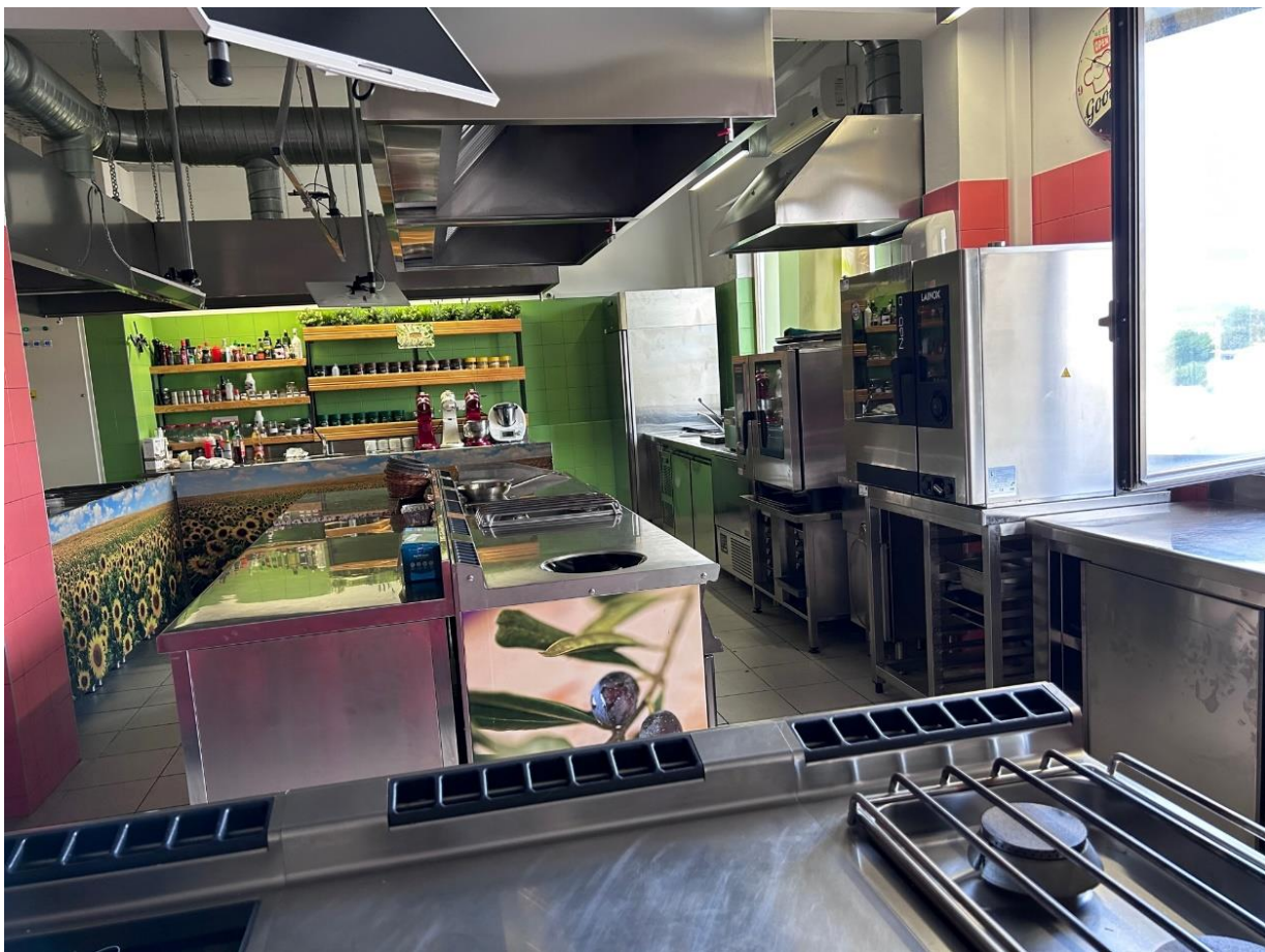
Na zdjęciach pracownia gastronomiczna.