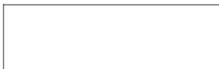
Rys. 1. Podpis pod rysunkiem Fig. 1. Figure description