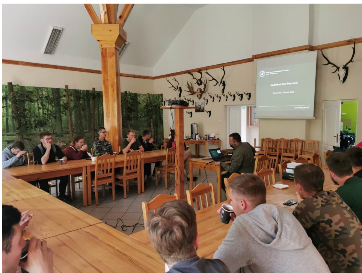
Fot. 8. Nadleśnictwo Parzew, wykład