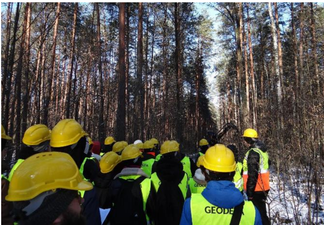
Fot. 12. Obserwacja prac harwestera