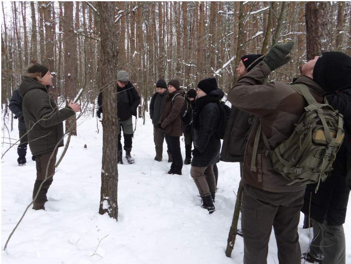
Fot. 16. Zajęcia w obwodzie Łowiszów