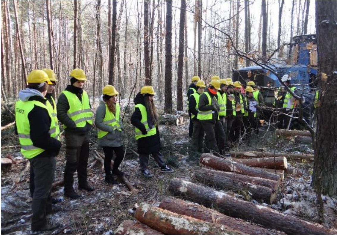
Fot. 13. Po wykonaniu ścinki drzew, ich przemieszczeniu i obalaniu, okrziesaniu i wyrzynki studenci zapoznali się z uzyskanymi sortymentami drewna