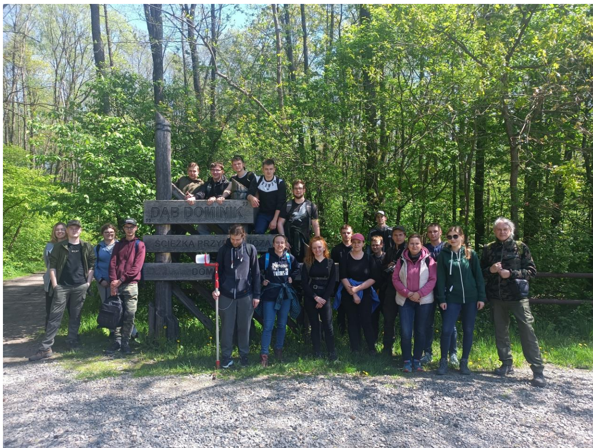
Fot. 1. Dwudniowe zajęcia terenowe w Poleskim PN, 11-12.05.2023 r., ścieżka przyrodnicza „Dąb Dominik”

Celem pierwszego wyjazdu był Poleski PN, zajęcia odbyły się w dniach 11-12.05.2023 r., uczestniczyła w nim grupa 36 studentów II roku oraz 6 prowadzących zajęcia (Fot. 1-3).