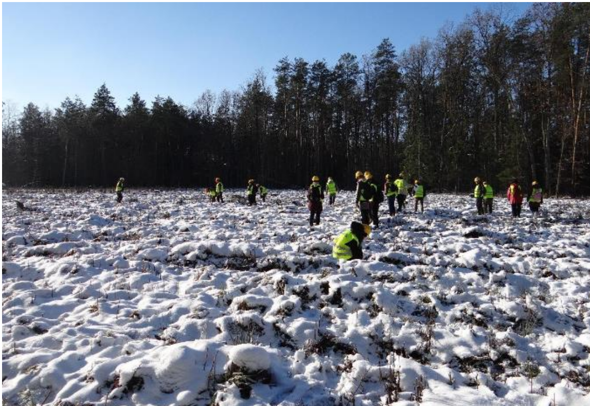
Fot. 14. Obserwacja uprawy sztucznej sosny zwyczajnej