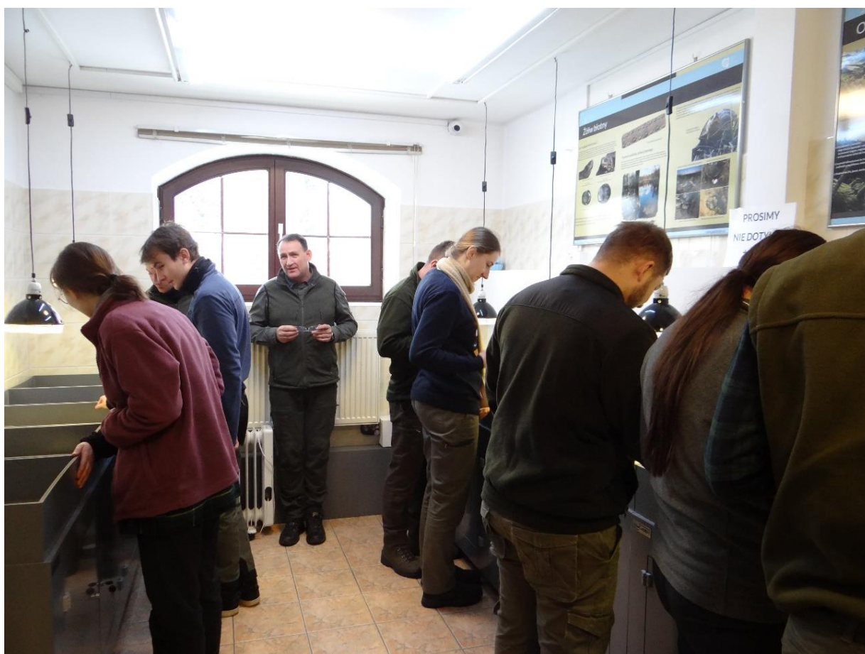
Fot. 15. Wizyta w Ośrodku Hodowli Zwierząt