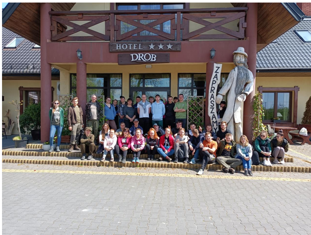
Fot. 2. Dwudniowe zajęcia terenowe w Poleskim PN, 11-12.05.2023 r., zdjęcie grupowe

Podczas wizyty studenci odwiedzili Dyрекcję Poleskiego PN, gdzie poznali zasady funkcjonowania Parku, oraz programy ochrony czynnej zagrożonych gatunków. Następnie odwiedzili Ośrodek Ochrony Żółwia Błotnego. Kolejnym punktem wyjazdu była wizyta w Ośrodku Edukacyjno-Muzealnym Poleskiego PN i poznanie działalności edukacyjnej prowadzonej w Parku. Studenci wysłuchali wykładu na temat walorów przyrodniczych i kulturowych PPN. Drugiego dnia wyjazdu studenci przeszli ścieżką dydaktyczną „Dąb Dominik” nad Jezioro Moszne, gdzie uczyli się o edukacji przyrodniczo-leśnej na terenie Poleskiego PN, poznali formy ochrony przyrody, analizowali zagrożenia występujące na obszarze Parku. Ponadto, poznali zbiorowiska roślinne występujące w borze bagiennym, na torfowisku przejściowym i torfowisku wysokim. Poznali efekty ochrony czynnej torfowisk wysokich i przejściowych oraz efekty reintrodukcji wierzby lapońskiej i borówkolistnej na torfowisku. Zapoznali się z charakterystyką ekosystemu jeziora polihumusowego na przykładzie Jeziora Moszne.