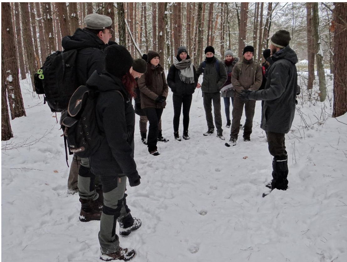
Fot. 17. Obserwacja tropów wilka