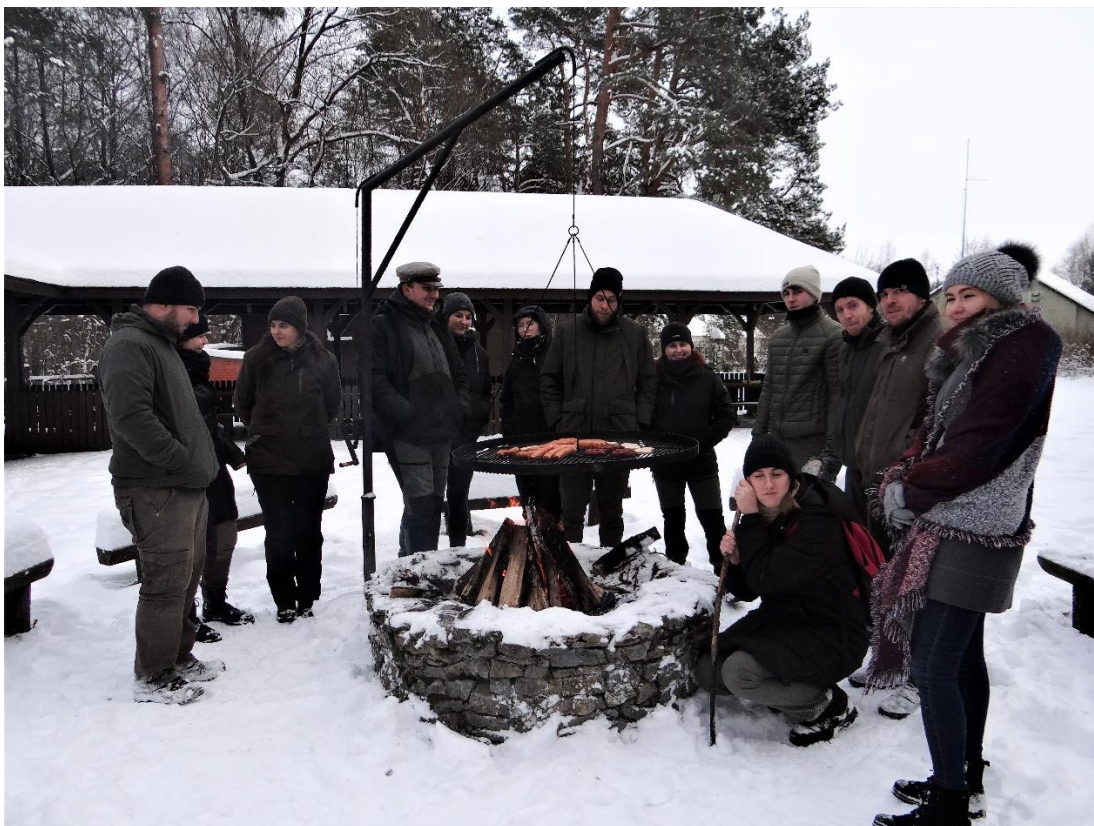
Fot. 19. Spotkanie przy ognisku na zakończenie zajęć