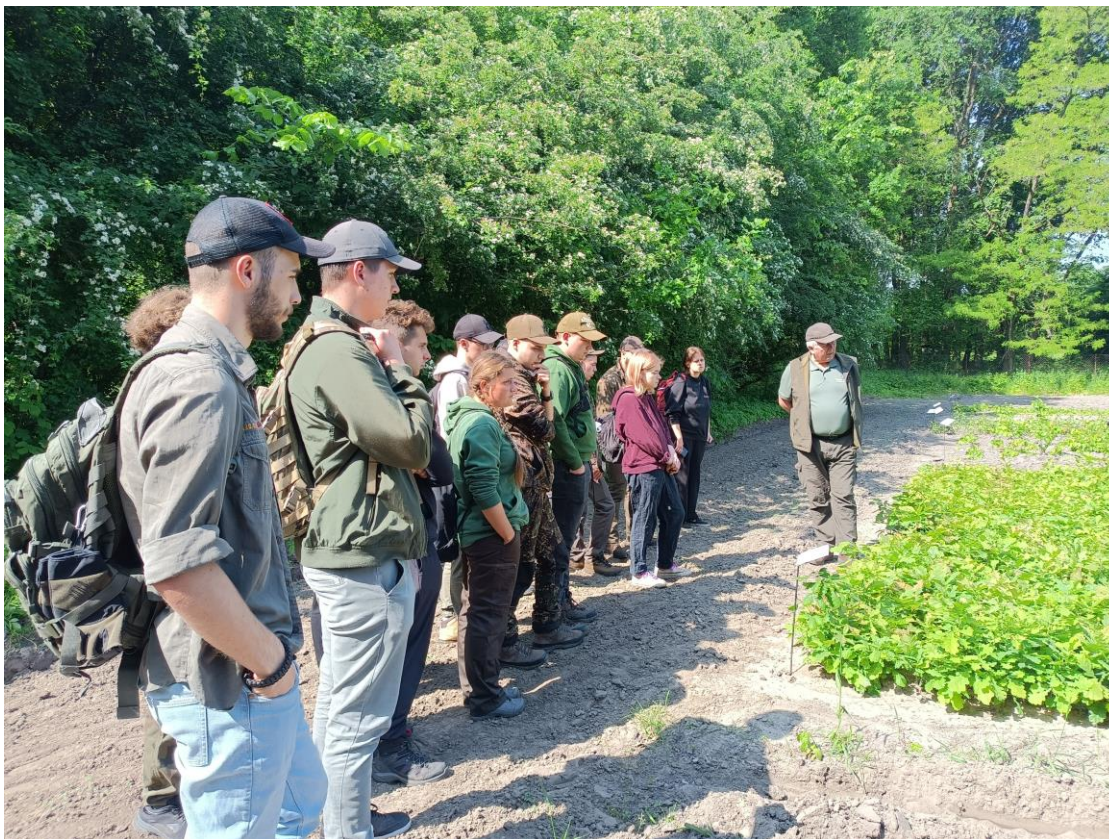
Fot. 9. Poleski PN, szkółka leśna