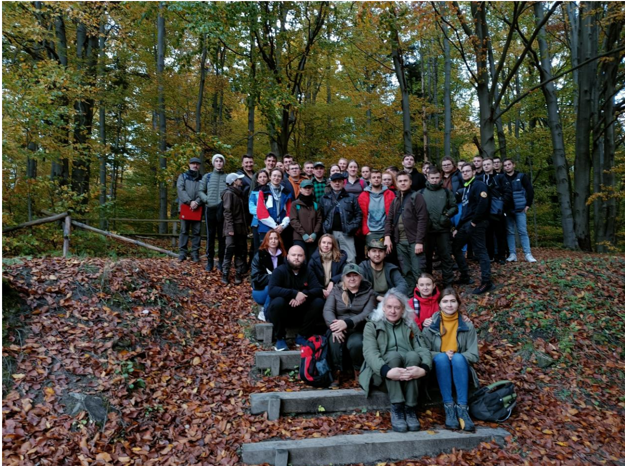
Fot. 4. Dwudniowe zajęcia terenowe w Roztoczańskim PN, 26-27.10.2023 r., zdjęcie grupowe na Bukowej Górze

prowadzonym na terenie Parku. Następnie przeszli ścieżką poznawczą na Białą Górę. Następnie grupa odwiedziła Stawy Echo, studenci poznali panujące tam warunki hydrologiczne oraz towarzyszące zbiorowiska roślinne. Ostatnim elementem wyjazdu był „marsz na azymut”. Studenci zostali podzieleni na 3 grupy, wykorzystując jedynie mapy papierowe oraz kompasy mieli dotrzeć do określonego celu, w miejscowości Kawęczynek.