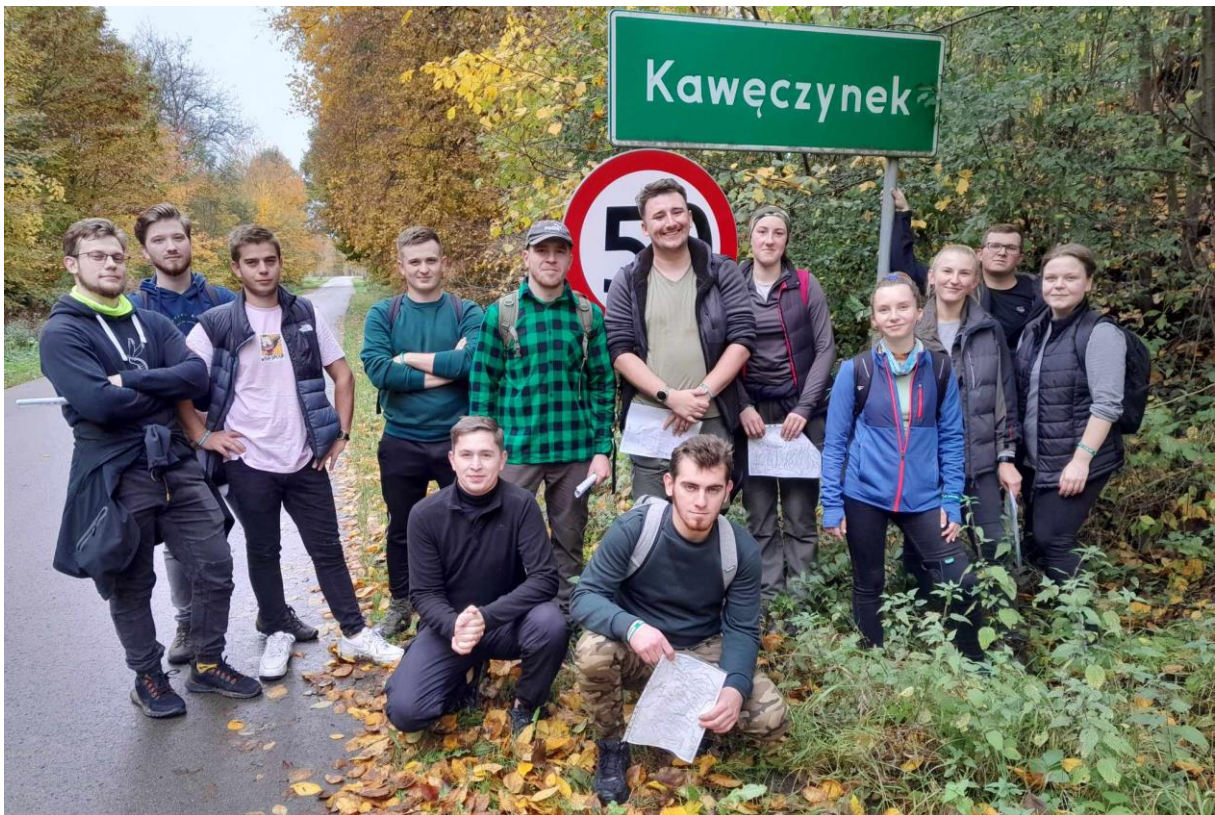
Fot. 6. Dwudniowe zajęcia terenowe w Roztoczańskim PN, 26-27.10.2023 r., „marsz na azymut” - zwycięzcy wyzwania