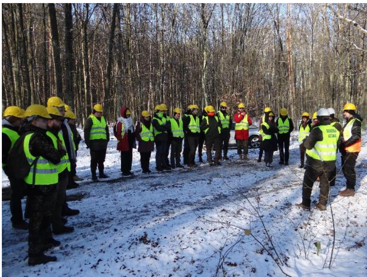
Fot. 10. Na wstępie studenci zostali zapoznani z zakazami oraz przepisami bhp obowiązującymi na terenach objętych zrywką drewna

Ze względu na duże zainteresowanie studentów, druga edycja zajęć odbyła się 1 grudnia 2023 r. Celem wyjazdu był Poleski PN, a wzięło w nim udział 19 studentów IV roku studiów. Studenci odwiedzili Dyrekcję PPN, Ośrodek Edukacyjno-Muzealny oraz ścieżkę dydaktyczną „Dąb Dominik”. Zakres tematyczny zajęć terenowych był zbliżony do tego, który odbył się w maju 2023 r.