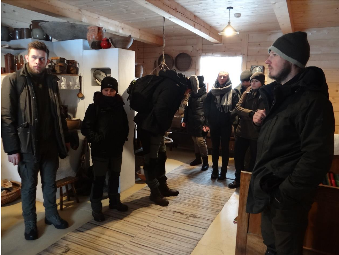
Fot. 18. Wizyta w Poleski Siole