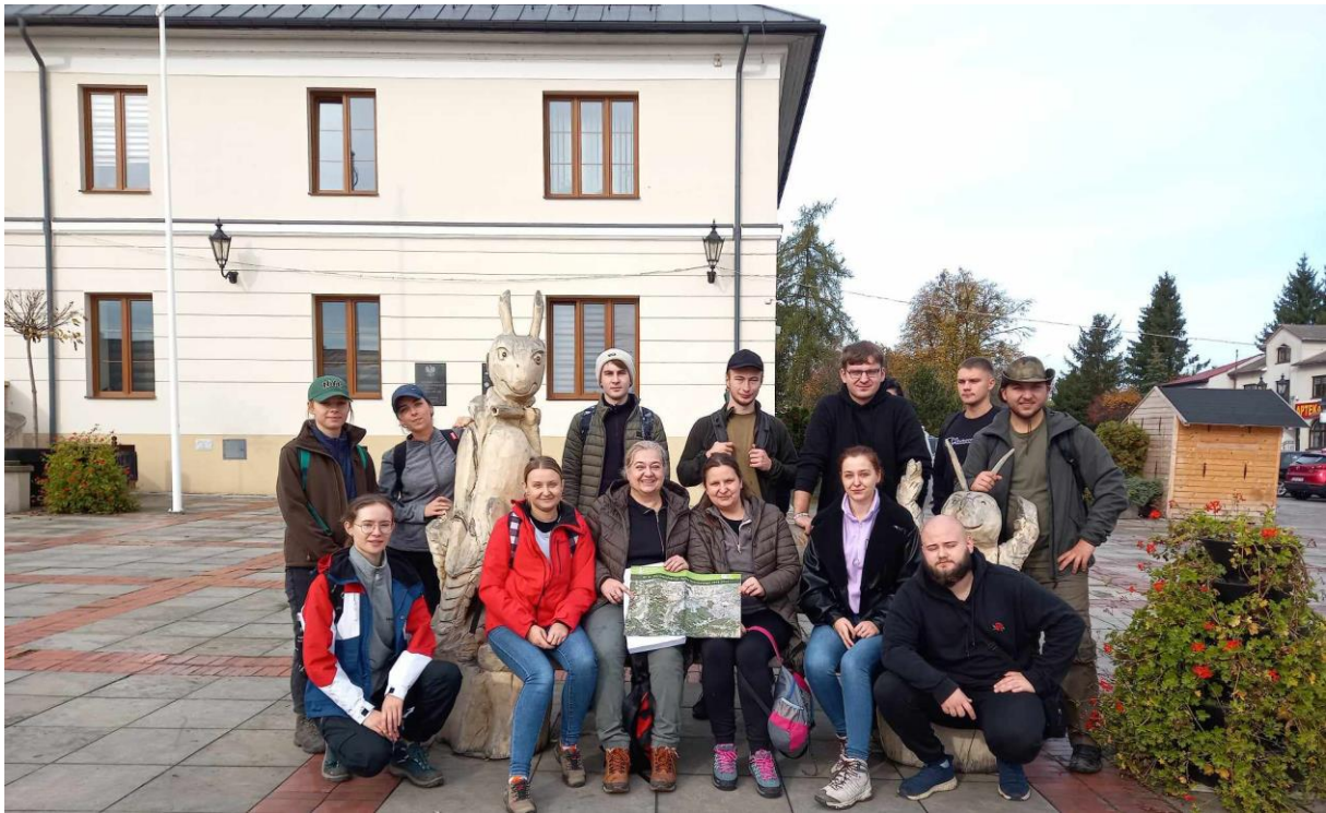
Fot. 5. Dwudniowe zajęcia terenowe w Roztoczańskim PN, 26-27.10.2023 r., „marsz na azymut” ze Szczebrzeszyna