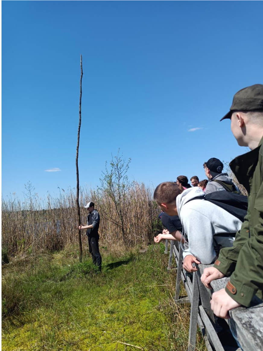
Fot. 3. Dwudniowe zajęcia terenowe w Poleskim PN, 11-12.05.2023 r., sprawdzanie głębokości torfu przy jeziorze Moszne

Drugi wyjazd finansowany z programu odbył się w dniach 26-27.10.2023 r., celem był Roztoczański PN (Fot. 4-6). W wyjeździe wzięła udział grupa 36 studentów III i IV roku oraz 6 prowadzących zajęcia. Pierwszego dnia studenci odwiedzili Ośrodek Edukacyjno-Muzealny Roztoczańskiego PN, gdzie wysłuchali wykładu wicedyrektora Parku dotyczącego zasad funkcjonowania RPN oraz realizowanych programów ochrony czynnej zagrożonych gatunków. Następnie zwiedzili Ośrodek oraz przeszli ścieżką dydaktyczną na Bukową Górę, gdzie poznali specyfikę prowadzenia gospodarki leśnej na terenie RPN, jak również geomorfologię, warunki hydrologiczne i glebowe RPN oraz towarzyszące zbiorowiska roślinne. Drugiego dnia studenci odwiedzili Roztoczańskie Centrum Naukowo-Edukacyjnego, zapoznali się z monitoringiem